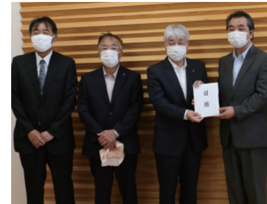
▲町長へ支援金を渡す協会の方々