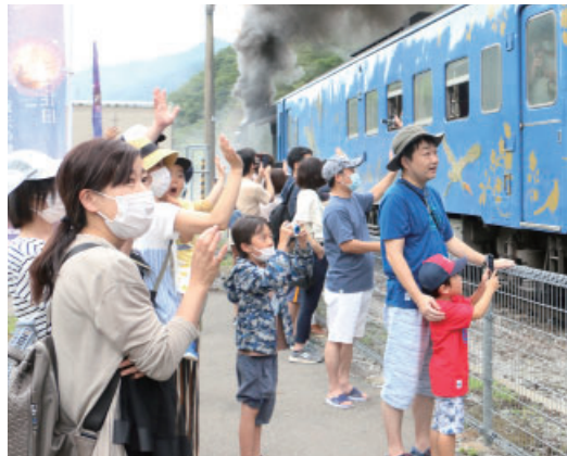
▲本年度は見納めとなったSL銀河

8月16日、上有住駅で一般の方に加え、本町のマスコットキャラクターのすみっここと五葉山火縄銃銃隊がSL銀河をお出迎えしました。 SL銀河は観光面からの復興支援と地域活性化を目的に平成26年に運行が開始され、今年も7月18日からこの日までの約1ヶ月間の休日に運行してきました。新型コロナウイルス感染症の影響により期間は短縮されましたが、最終日のこの日は乗車率が9割を超え、見物客も多く、大反響でした。 JR東日本盛岡支社では、釜石線が10月10日に開業70周年を迎えるにあたり、記念企画も予定しています。