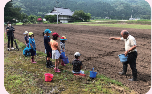
◀下有住地区で行われたそばまきの様子