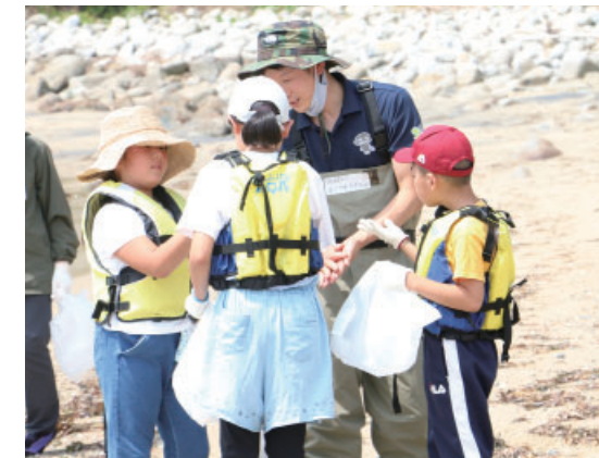
▲「先生これなんですか〜？」