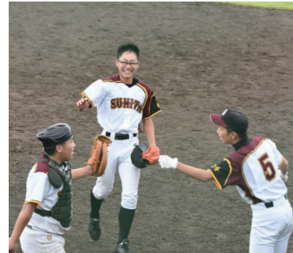
▲ナイスプレーにはじける笑顔