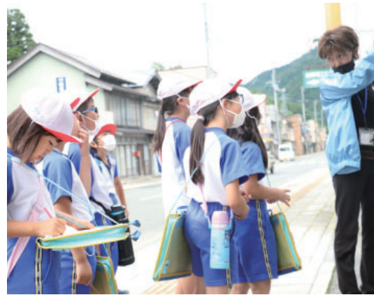
▲ガイドの話をも熱心に聞く児童たち