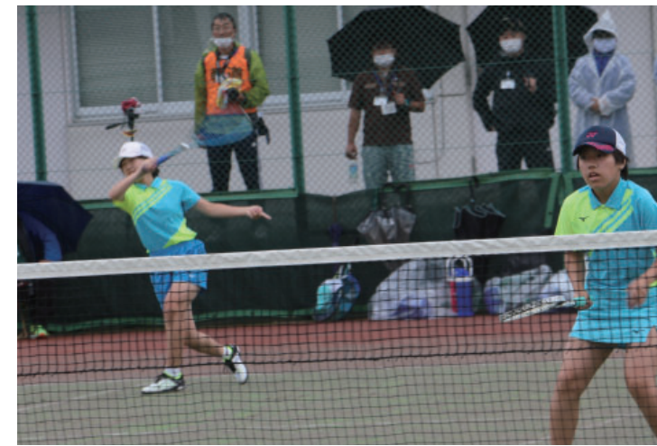
▲最後まで粘り強くボールに食らいつく