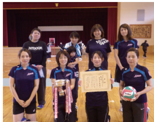
▲優勝した愛宕チーム

7月5日、生涯スポーツセンターで、第51回家庭バレーボール大会を開催しました。 この大会は、バレーボールを楽しむことを通して、生涯スポーツに親しみ、お互いに親睦を深めながら体力づくりをすることを目的に開催したものです。 新型コロナウイルス感染症拡大防止のため、消毒や換気などの感染対策を実施した上での開催。 大会には、愛宕チーム、下在チーム、火の土・月山チームの3チームが出場し、総当たりのリーグ戦の結果、2勝した愛宕チームが2年ぶり4回目の優勝を果たしました。