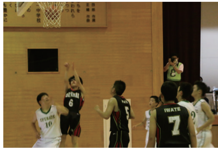
▲ジャンプシュートを決めチームに勢をつける