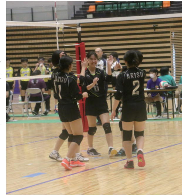
▶チームみんなで喜びを分かち合う

7月11日～14日にかけて気仙地区中学校総合体育大会が開催されました。 本年度は、新型コロナウイルス感染症拡大防止のため、全競技無観客での試合となりました。ここでは、中学生の活躍の様子を紹介します。