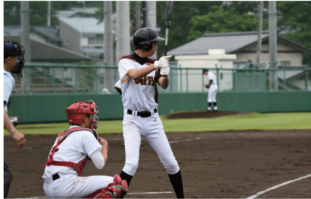
▶キャプテンが一振りにかける