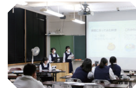
▲構想発表会の様子