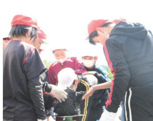
▲取り出された鉄に興味深々の児童