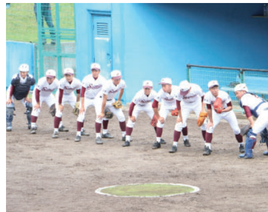
▲プレイボールを楽しみに待つ選手たち

7月2日から3日にかけて、地域創造学の一環として、有住小学校でたたら製鉄体験が行われました。 はじめに、炉の組み立てや鉄鉱石砕き、炭切りを行い、次の工程で砕いた鉄鉱石と木炭を炉に投入し、最後に鉄を取り出します。 最終的に取り出された鉄は5キロにもなり、児童たちは興味深々に鉄を眺めていました。 児童たちは「鉄作りの難しさも分かった」「昔の人の暮らしの大変さも分かった」「貴重な体験をすることができて良かった」と感想を話し、昔の人々の暮らしを学びました。