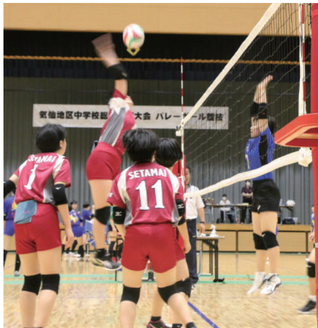
▶エースの気持ちのこもったスパイク