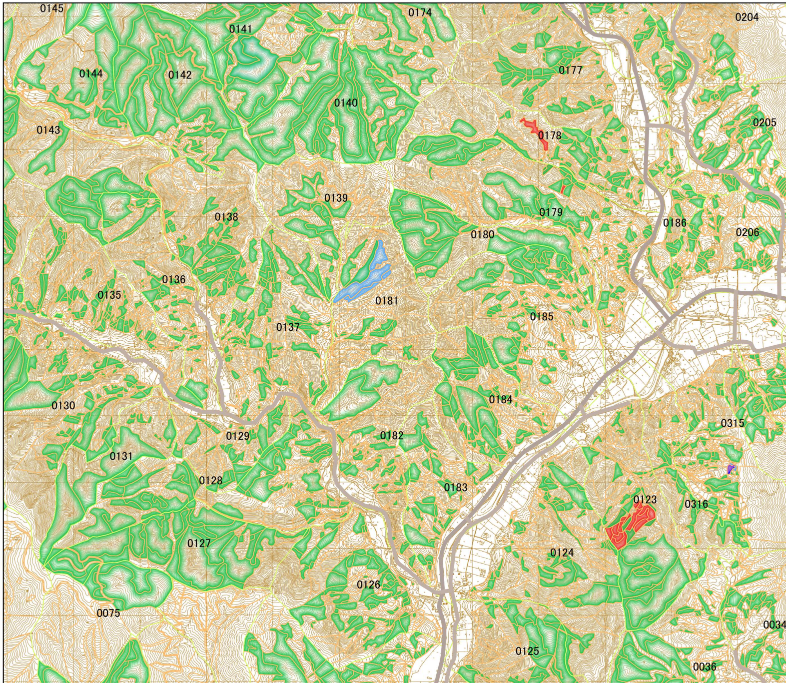
特定間伐等促進計画 (令和3年5月策定) 図7