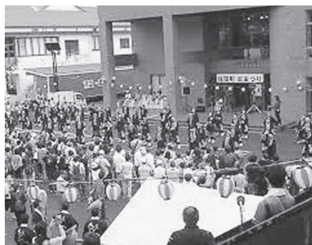
観光協会による夏祭り