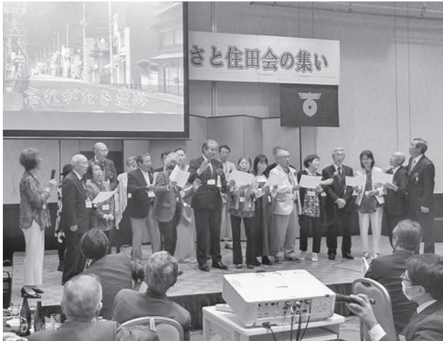
△ 住田会役員による「ふるさと」の合唱