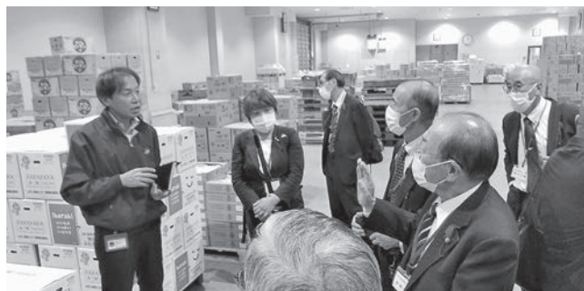
△ 県産野菜の出荷状況や買い手の視点を質問