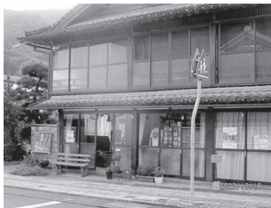
△ 店頭やインターネット販売を中心に展開をしている起業5年目の事業所