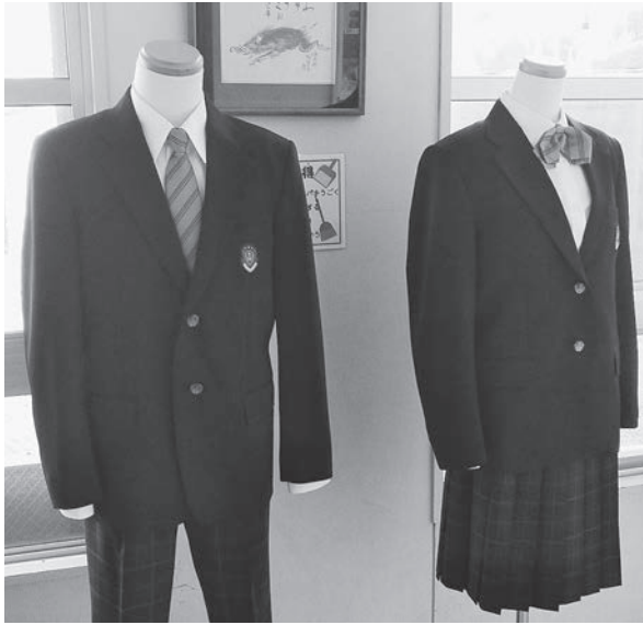
△ 住田中学校の設置に伴い、制服や運動着、通学かばんなどが新調された

世田米中学校と有住中学校の統合は、令和3年度より、教育審議会や学校統合推進協議会、保護者説明会、住民説明会を開催して民意の反映に努め、合意形成を図ってきた。協議の結果、令和6年4月より、2校を廃止し、新たな学校を定める方向性に至った。 新たに設置する校名を「住田町立住田中学校」とし、来年4月の開校に向けて、校歌や校章、制服など所要の整備を図る。