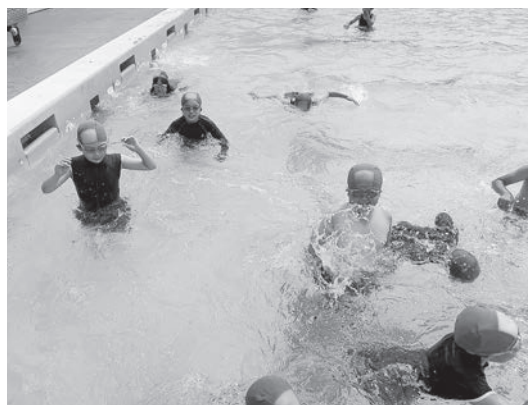
△ 水泳の授業で元気に泳ぐ子どもたち

水泳は、子どもから高齢者まで対応できるスポーツである。一方プールは、建設費や維持管理費が高額となる。周辺自治体に整備されている。整備の要望が寄せられていないなどのことがある。現状でのプールの整備は考えていないが、今後の役場周辺や学校統合の施設整備の中で、慎重に考えていきたい。