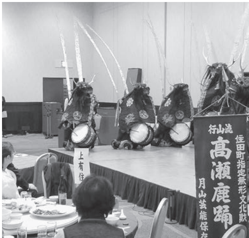
▷ 月山芸能保存会による「行山流高瀬獅子踊り」