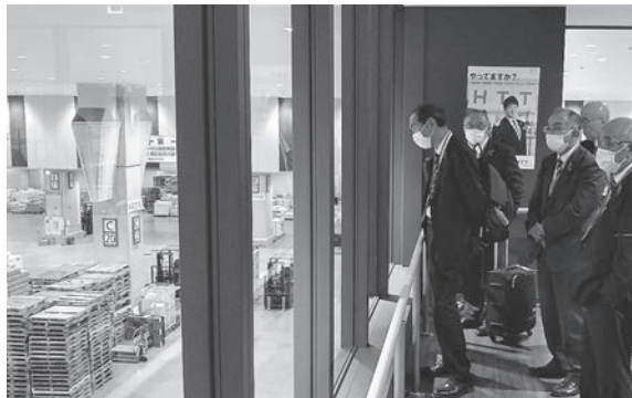
△ 見学ブースより青果市場を一望