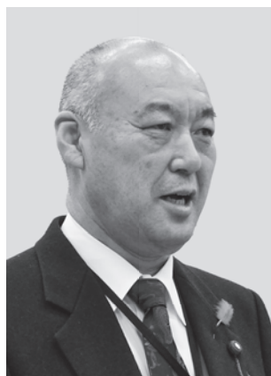
おぎわら 荻原 まさる 議員

住田高校教育振興会及び住田高校魅力化推進会議で委員の方々に説明し、協議していただき、情報共有と検討を行っている。今後は、町民の皆様にご意見をオープン化し、会議の内容に関して住田広報など様々な媒体及び機会を通じて紹介していきたいと考えている。