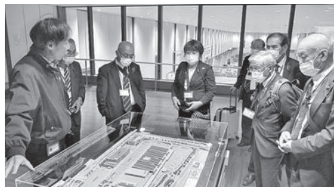
△ 模型により施設全容の説明を受ける