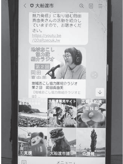
△ 大船渡市のLINEは、市民以外でも様々な情報が得られる