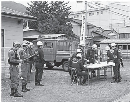
消防団による演習