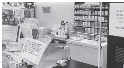
△年中無休のコンビニでの収納が可能となり、納付者の利便性向上が図られる

税、国民健康保険税をはじめ、水道料、下水道料、町営住宅家賃などの口座振替が可能な各種料金を対象としたい。ほとんどのコンビニで収納が可能となり、スマートフォンによる決済も可能となる。