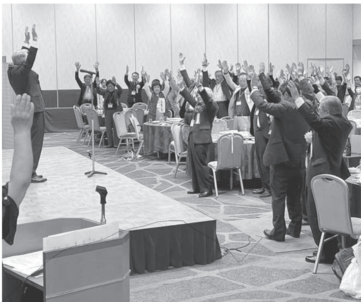
△ 再会を誓い、参加者全員で万歳三唱