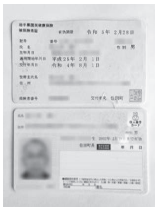
△マイナンバーカードに一本化される「健康保険証」。保険証の存続も簡素で確実と思われるが

問 国保税には、応益負担という考え方により被保険者の人数によって課税される均等割があり、子育て世帯にとつては、子どもが増えると税負担が増える。子どもの均等割を減免すべきと思うが。 答 町長 令和4年度から未就学