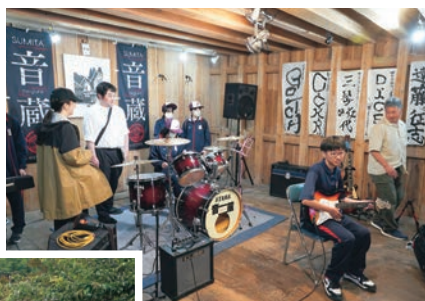
住田町の魅力を再発見。 高校生たちの豊かな学び につながることを期待されます。

このツアーは、地域創造学（探究活動）を進めるうえで、まず地域について理解を深めることを目的とした活動です。町役場を出発して、町民の音楽活動に利用されている施設「音蔵」で楽器や音を楽しみ、まちや世田米駅で「USCOFFEE」のドーナツをいただき、世田米商店街を歩きました。