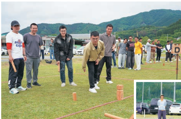
年齢問わず誰でもできる「クラブ」。 町内外の方々が笑顔でプレーしました。

スウェーデン生まれの伝統的な薪投げゲーム「クラブ」を通じて交流を深めるこの大会には、北は北海道、南は東南アジア（技能実習生）から33チームが参加。少し肌寒い、あいにくの曇り空でしたが、好プレー珍プレーが繰り広げられ、最後まで熱気あふれる大会となりました。