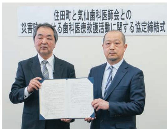
災害時の歯科医療体制の強化を図っていきます

所などで迅速な処置ができるように、気仙歯科医師会と協定を締結する運びとなりました。