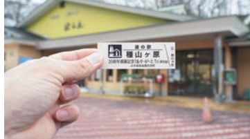
25周年記念の道の駅切符

あいにくの天気でしたが、店内だけではなく、駐車場の一角にもお店が並び、物産品やお土産を販売。買い物されたお客様には記念として、25周年記念の道の駅切符を配っていました。