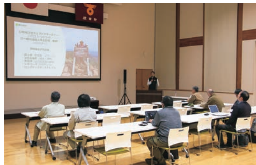
役場町民ホールで行われた活動報告会には、町内外から10人余りが参加

し、今も継続されています。4月30日で任期を終える関さんですが、5月1日から指定管理者「一般社団法人 浄土日和」の職員として勤務し、施設の利用活用を図るため活動しており、さらなる活躍に期待が高まります。