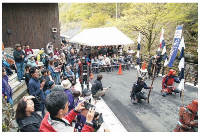
火縄銃のごう音と県内外からの来客の歓声が響き渡りました。

4日は、地元産出のヒノキによる火縄銃を使った、五葉山火縄銃鉄砲隊の演武が、大歓声の中行われました。