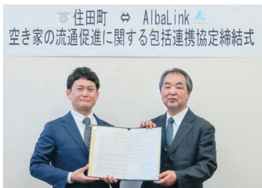
空き家の有効活用で、よい良い住環境の整備を目指していきます

クと協定を締結することで、所有者などの空き家に関する相談体制を拡充して解決に結び付け、地域に残るさまざまな空き家の流通促進を図ることにより、安全安心な暮らしの実現を目的としています。