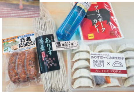
ブランド豚「ありすぽーく」の人気商品がずらり。