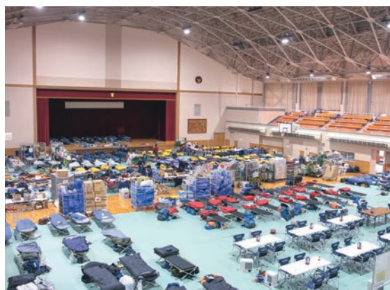
▲ 拠点となった生涯スポーツセンターの様子

町は、施設提供に加え、隊員の滞在期間における入浴、買い物など生活面での連絡調整を支援しました。