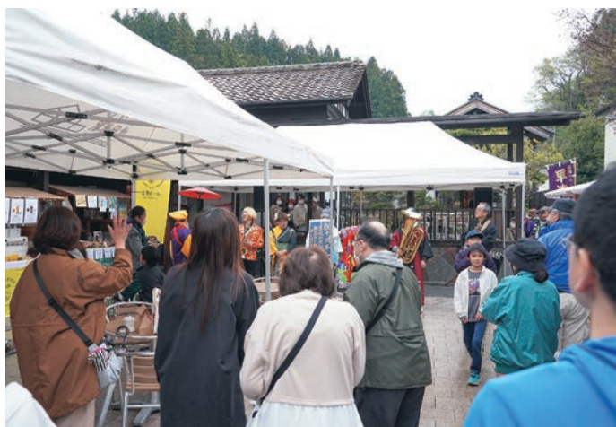
各種イベントが催され、幅広い年代で賑わいをみせました。

古本やレコード、駄菓子などの屋台・キッチンカーが立ち並び、人気のコーヒーショップや軽食のお店には行列が。また、甲冑着付体験やちんどん屋などのイベントも人気を博していました。