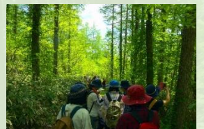
種山ヶ原の散策イベント