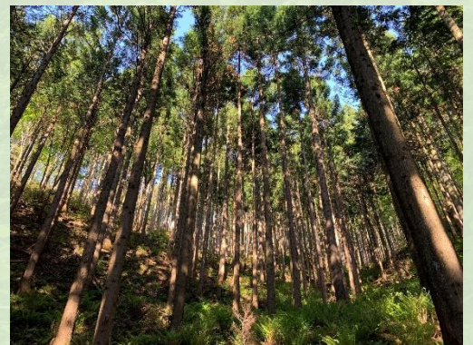
適切に間伐がなされたスギ人工林

※FSC森林認証：「環境・社会・経済の面で持続可能な森林管理が行われていること」を認証する国際的な制度。