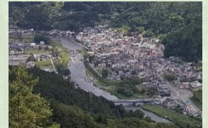
中心市街地を流れる 清流・気仙川