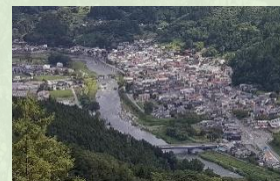
中心市街地を流れる清流・気仙川