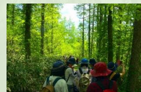
種山ヶ原の散策イベント