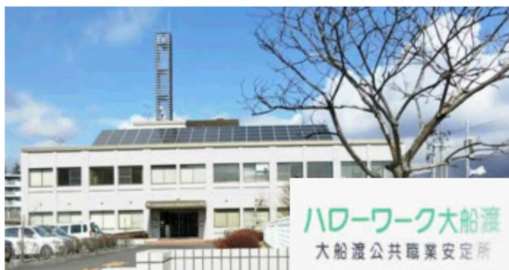
ハローワーク大船渡 大船渡公共職業安定所