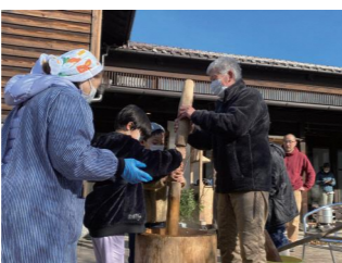
つき手と返し手の息が、なかなか合わないも楽しい

夏のうちにみずきの目星をつけておき、当日までに切り出して用意しておくという、裏方の力も継承させていきたいですね。