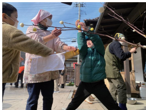
全体のバランスを見ながら飾りつけをしていきます

この行事は、昔ながらのもちつきやみずき団子づくりを体験できる場として、子どもたちやその親世代に好評で、毎年開催しています。今回は親子で参加できるように日曜日に初開催。全く未経験の方も、手慣れた方々の手ほどきを受けながら、作業を進めました。