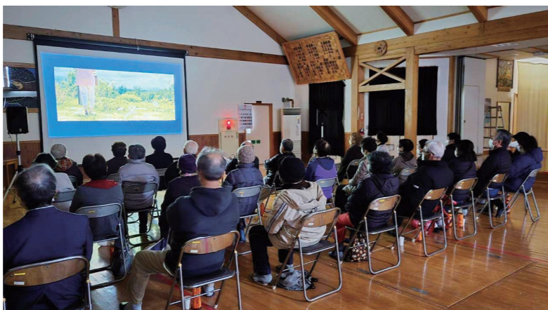
映画上映会の様子

スマイル大股では、映画上映会が実施できるよう音響機材を揃えており、今回の上映会でも活躍しています。