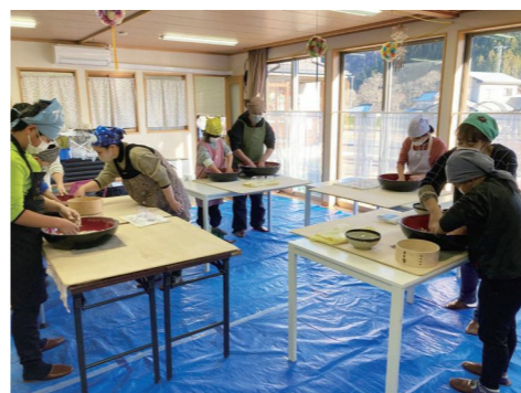
粉が麺になるまで、みな夢中になって挑みました

参加した人の多くは種まきにも参加したことがあり、種まき、収穫、製粉、そば打ちという一連の工程を学び、体験することで、ふるさとの風土と「食」への関心が高まったようです。