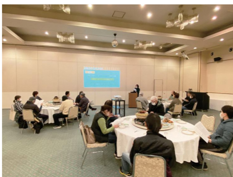
総会も合わせて開催され、活動報告や決算・新年度の計画や予算が承認されました

せたまいいきいきづくりの1年間の活動を振り返りながら、新年度に向けたアイデアや意気込みを語り合う会が、グリーンベル高勤で開催されました。せたまいいきいきづくりに初めて参加する方からは、多彩な活動を地域の方々の手で進められていることに賞賛する声が上がりました。地域の人が集まって地域のことを話す機会を続けたいとの声もありました。