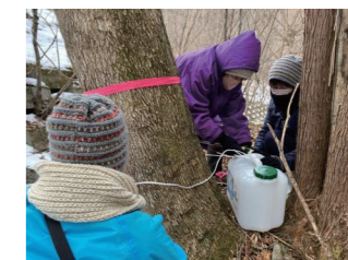
ドリルで穴をあけた瞬間から樹液が流れてくる木もありました