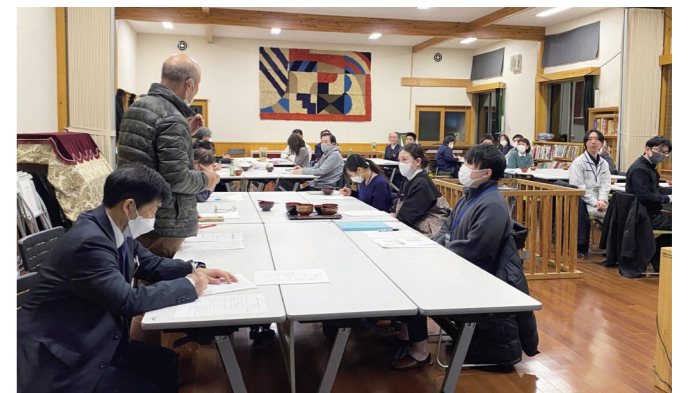
下有住で収穫したそばを試食しながらの運営会議となりました

ましたが、8年経ったいま、改めて地域を見つめ直したいという機運が高まっています。