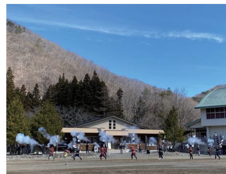
五葉山火縄銃鉄砲隊による演武など、伝統行事も披露されました

今年は、縄文遺跡についての講演会や、栄養たっぷりの手作り料理を振る舞うみんな食堂も開催され、昨年とはまた違った催しとなりました。また昨年引き続き実施したバザーも盛況となりました。