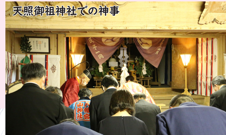
天照御祖神社での神事

この式年大祭は、穏やかで心豊かな生活ができるようにと、五穀豊穡と無病息災、招福を祈願し、明治時代から世田米地区で行われているお祭りです。午前9時から神事が行われ、12時から神輿・御供行列が出発し、その後上組、下組、東峰組、中沢組による山車や手踊りが披露されました。 華やかな衣装に身を包んだ演者に対し、見物客から大きな歓声と拍手が送られています。 5月4日、天照御祖神社式年大祭が世田米商店街で挙行されました。3年に一度に行われ、本来ならば昨年行われるはずでしたが、新型コロナウイルスの影響により1年延期となり今年の開催となりました。