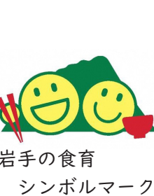
岩手の食育シンボルマーク

毎年6月は食育週間、毎月19日は食育の日です！この機会に、ご自分や家族の食生活を振り返り、食事バランスや食品ロスなどの正しい知識を身につけ、食品を購入する際は栄養成分表示などを参考にしましょう！