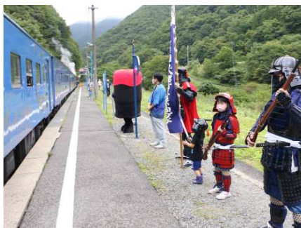
▲SL銀河をお出迎えした鉄砲隊

この日のSL銀河には、普段乗車することができない『SL運転台』に乗車して走行体験ができるプレミアムな切符もあったようです。