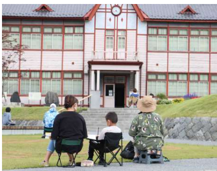
▲民俗資料館を目の前にスケッチする参加者