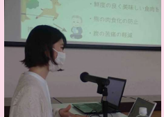
▲最終日の発表の様子

町林業振興協議会では9月5日から16日までの約2週間、町の林業に興味のある岩手大学の学生1名を受け入れ、林業に関わる仕事の体験会を行いました。