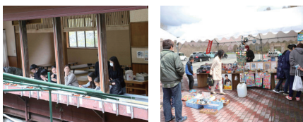
▲滝観洞 ▲道の駅種山ヶ原ぼらん

まち家世田米駅で行われた蚤の市では、住田食材研究会と陸前高田市のビール醸造所とで商品化を進めてきた、町内産イタヤカエデの樹液を使ったビール「KAEDE ALE(カエデエール)」を販売。今後商品を通じた活性化が期待されます。