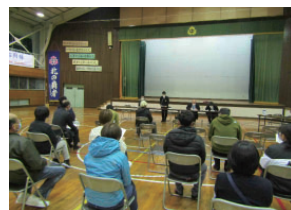
▲有住地区保護者への説明会