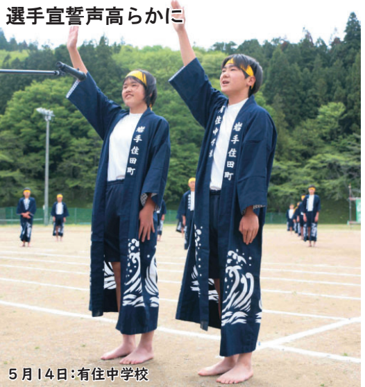
選手宣誓声高らかに