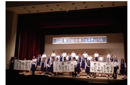
▲3年前の不来方高校の発表