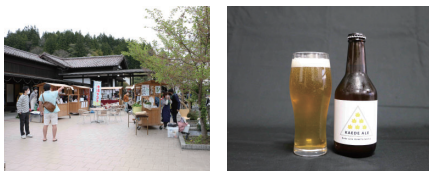
▲まち家世田米駅 ▲カエデエール