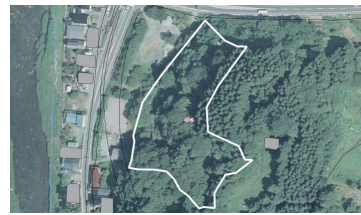
▲林地台帳地図のイメージ

土地の場所を探す参考資料として、林政課において、航空写真や地形図をお持ちの森林の区画を示した「林地台帳地図の閲覧、交付」を申請することができます。申請のときには、納