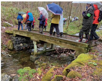
▲森林公園内を散策する参加者ら

前々日に季節外れの積雪があったため、雪と桜や春の山野草という異色のコラボがきれいに映っていました。