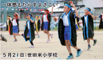
一体感もたらずよきこい