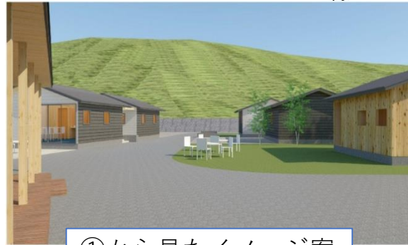
①から見たイメージ案

町外の人たちがオフィスとしても利用可能だったり、町内の人たちも会議や勉強、仕事をするスペースとしても利用可。