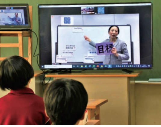
▲今年はオンラインで開催