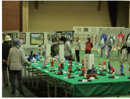
▲町民の力作がずらり

例年盛大に開催される文化・産業まつり。本年度は、新型コロナウイルス感染症の感染拡大防止のため、10月23日から25日までの3日間、社会体育館を会場に作品展のみ開催しました。期間中は児童生徒の作品や、絵画、書道、文芸、工芸、生け花など多種多様な作品が会場を彩りました。作品展をご覧になった方からは「今年度は催しがない分、作品をじっくり見られるなあ」という声も聞かれました。