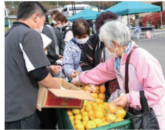
▲詰め放題に挑戦する地域の皆さん