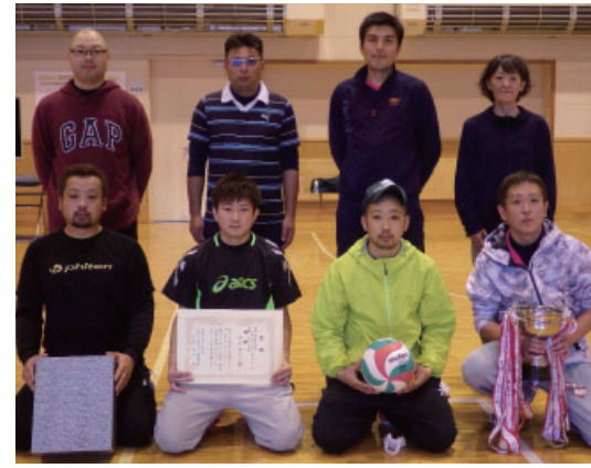
▲優勝した坂本・恵山チームの皆さん

11月8日、第44回成人バレーボールナイターリーグ決勝大会を町生涯スポーツセンターで開催しました。大会は年齢制限を設け、スポーツライリーの一つ目として毎年開催しているものです。また、各自治公民館単位で幅広い年代で楽しめる大会としても長年親しまれています。 決勝大会では、予選リーグの結果をもとに、決勝トーナメントと交流トーナメントに分かれて白熱した試合を展開。 その結果、予選リーグから決勝トーナメントまでの計7試合すべてでストレート勝ちした坂本・恵山チームが、見事優勝に輝きました。