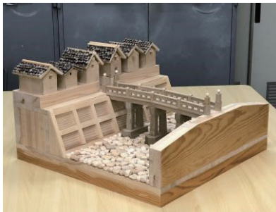
▲木工作品(世中特設木工部)