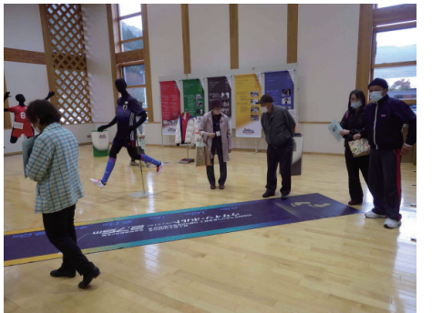
▲世界記録のすごさを感じる

思わず足を止めて、話かたり。なつかしい世田米の風景やら人物が盛りだくさんの写真展となりました。当日は、せたまいいきいきづくりの役員が交替でアンケートを取ったり来場者と一緒に写真を見ながら話かたりをしたりするなど、あたたかい空気に包まれました。