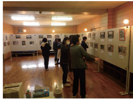
▲世田米の懐かしい風景が展示

足が止まって話かたり 昔なつかし写真展 せたまいいきいきづくり主催の「昔なつかし写真展」が、社会体育館トレーニングルームを会場に、文化・産業まつり作品展と同時開催されました。