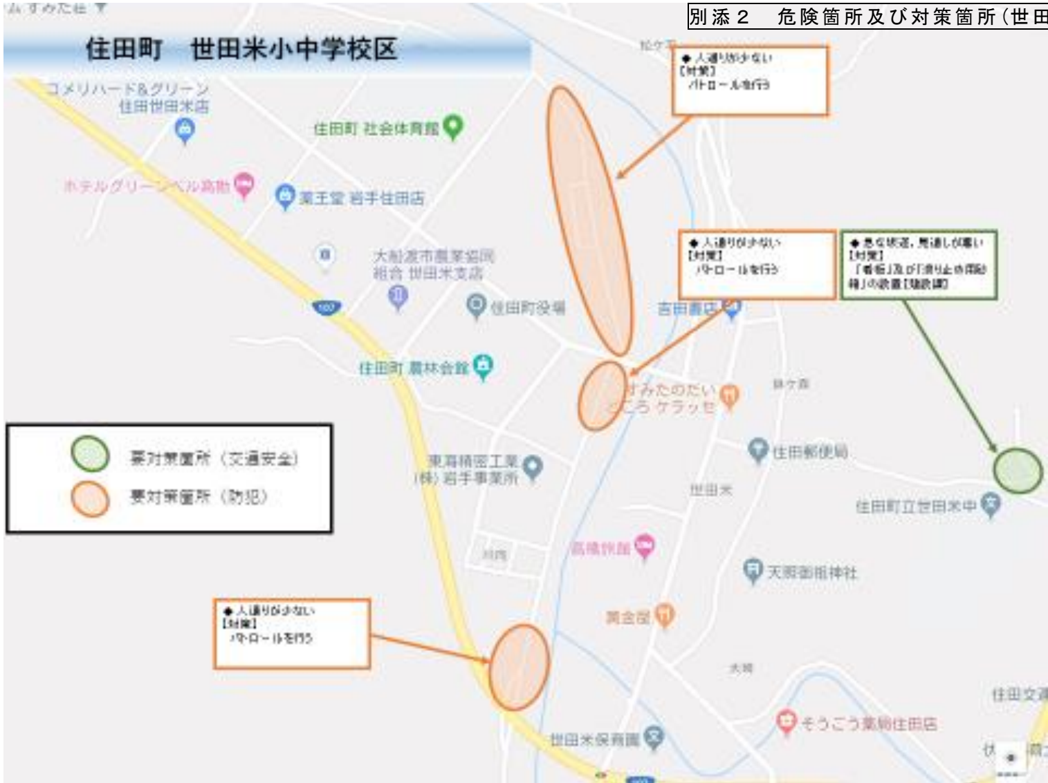
別添2 危険箇所及び対策箇所(世田米地区)