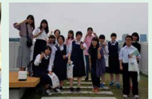
△ 住田を飛び出し東京へ！津田塾大学を見学してきました