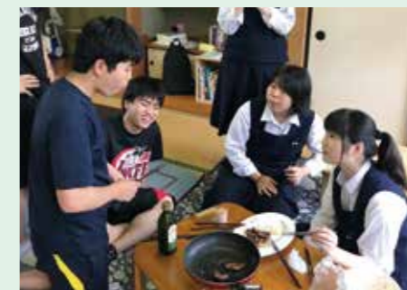
△ 時には地域の方からの差し入れも!? 鹿肉試食の様子