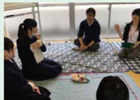
△ ある日の「かたらっせん」の様子

住田町で英語を教えているALTの先生方と気軽に英会話！地域のオトナも参加しながら、みんなで楽しく英語を学びます。