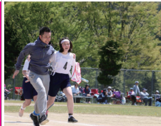
▲息の合った走りを見せます！（世中）

運動会シーズンを迎えた5月、週末は小中学校に応援の太鼓や児童、生徒の声が響き渡りました。ここでは、町内の中学校で行われた運動会の様子をお届けします。