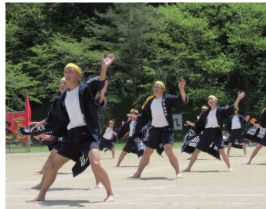
▲一糸乱れぬ動きの有中ソーラン