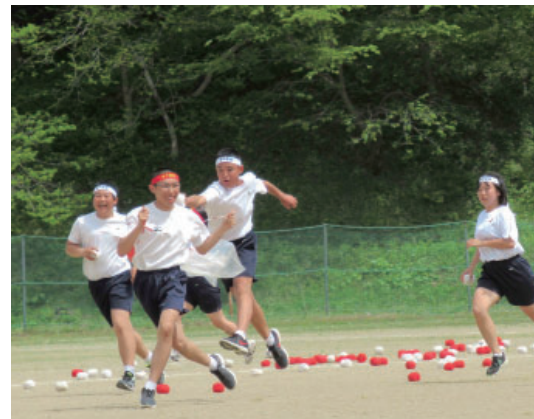
▲新時代の玉入れはかごが動く！（有中）