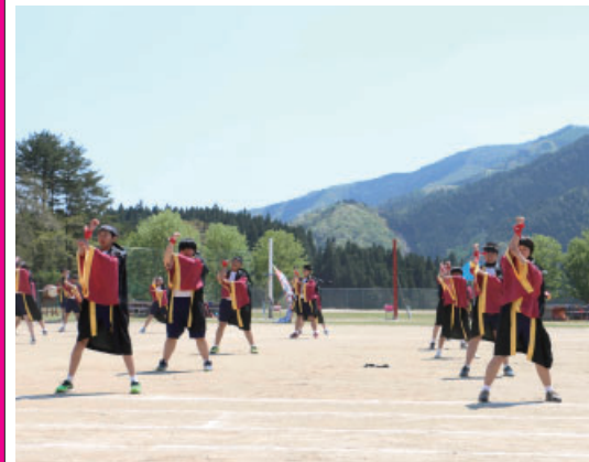
▲勇壮な踊りを見せた世中ソーラン