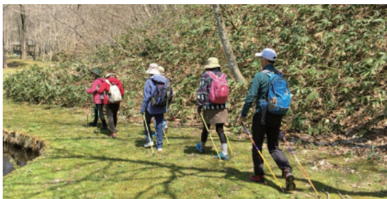
▲春の種山ノルディックウォーキングの様子

糖尿病などの生活習慣病予防を考えた場合、体重を3～4%減らすだけでも効果があると知られており、食事コントロールだけではなかなか効率のいい体重減少や腹囲減少は難しいのが現状です。そこで、食事と運動を組み合わせる必要があります。