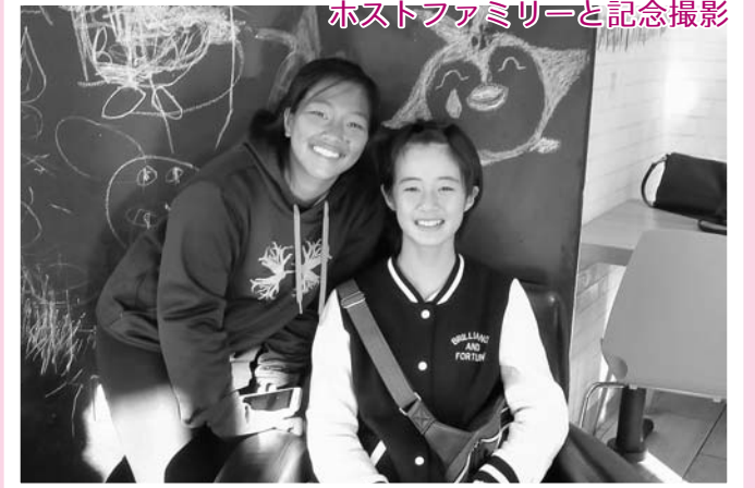
ホストファミリーと記念撮影