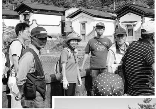
地域資源の有効活用としての「町歩きガイド」

町民誰もが、子供から高齢者まで学び続けることのできる地域社会の構築のため、「第8次住田町教育振興基本計画」、「第4次住田町生涯学習推進基本計画」に基づき特色ある教育の展開に取り組んでまいります。なお、2つの計画については、平成29年度において新計画の策定を行います。