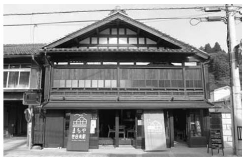
昨年6月にオープンした「まち家世田米駅」