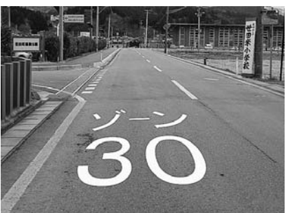
本年4月より設置される「ゾーン30」（イメージ）