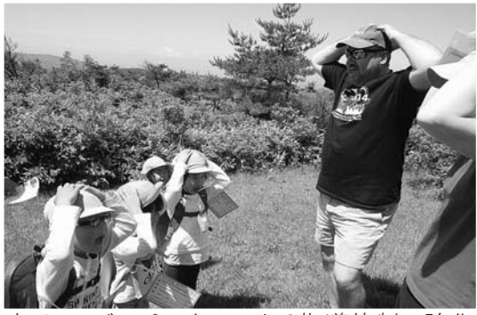
ネイティブスピーカーによる指導体制の強化