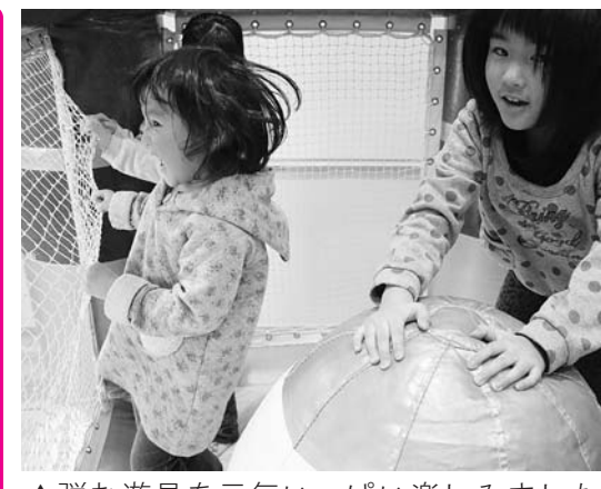
▲弾む遊具を元気いっぱい楽しみました