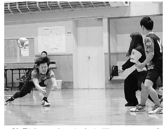
▲強烈なスパイクを必死にレシーブ