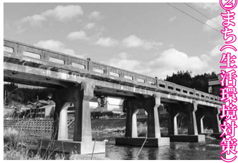
②まち（生活環境対策）