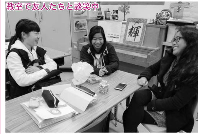
教室で友人たちと談笑中