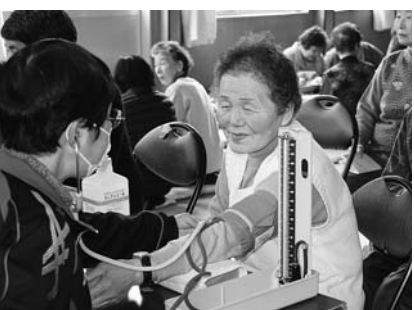
健康で安心して生活できる環境を