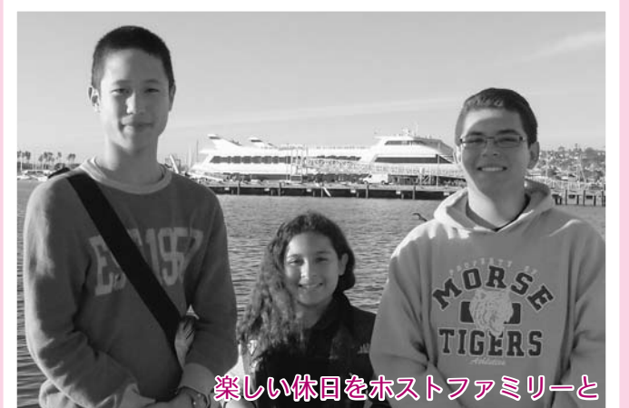
楽しい休日をホストファミリーと