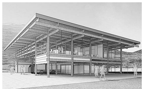
来年度、住田分署の建て替えがスタート