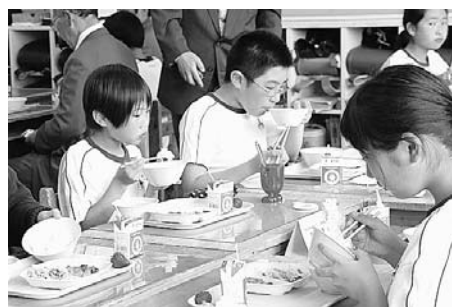
町産食材を活用した「すみたっ子給食」