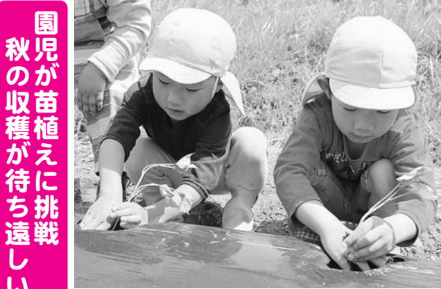
▲大きく育つように一生懸命植えました

山開きには、多田町長や江口友之奥州市副市長ら関係者が出席し、種山の安全を祈願した後、「今日は宮沢賢治に思いをはせ、種山の豊かな自然を満喫してほしい」と多田町長が種山高原観光協会会長である小沢奥州市長のあいさつを代読しました。山開きを告げるテープカットを皮切りに、会場では、郷土芸能やすみだ森の案内人の会(吉田洋一會長)による物見山までのハイキング、ご当地キャラクターによるアトラクションなどのイベントが行われました。このうち本町からは、鳴瀬太鼓が演奏を披露し、迫力ある太鼓の音に観客からは大きな拍手が送られました。会場に訪れた観光客は、家族でシート広げ、ジンギスカンを味わうなど待ちわびた初夏の行楽シーズン到来を楽しんでいました。