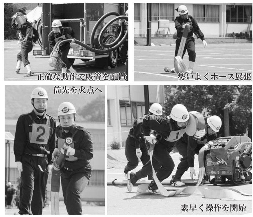
正確な動作で吸管を配置