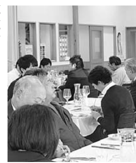
▲メニュー開発のため試食会を開催

④住田の食を応援する 女子会「す〜みん」 食に関わる町内の女性で構成されるワーキングチームです。住田の伝統食について学び、女性目線での郷土菓子の商品化などに取り組んでいます。 ⑤地産地消レストランのメニュー開発 町内外の方に町産食材を提供するため、昨年10月、地域おこし協力隊員を任用し、町産食材を活かしたレストランメニューの開発に取り組み、まち家世田米駅内のレストランで提供しています。食をテーマとした交流人口の拡大と地元産食材の消費拡大を進めます。