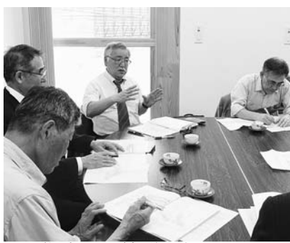
▲国指定への協議が始まりました

栗木鉄山は、子飼沢地内において明治14年から大正9年まで稼働し、最盛期には銑鉄生産量が全国で第4位を誇った製鉄所です。現在も石垣や水路、高炉付近の遺構が残されているほか、発掘調査により炉底や炉の基礎が良好な状態で見つかりました。