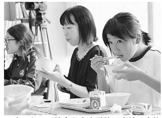
▲すみたっ子給食を小中学校・高校で実施

「食いくプロジェクト」は、総合戦略に掲げる「しごと・1人当たり町民所得の10%増」を実現するための重点施策の一つです。住田の食を学ぶことと地元産食材を使った給食やメニューの開発から特産品を生み出すことで新たな産業を創出するなど、しごとづくりを応援するものです。このプロジェクトは、次の5つの取り組みを推進しています。