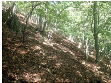
第 18 回調査（2025 年 10 月 3 日）