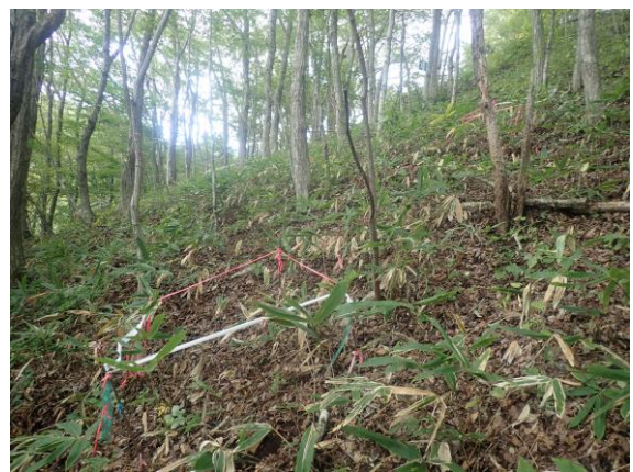
第18回調査時（2025年10月2日）