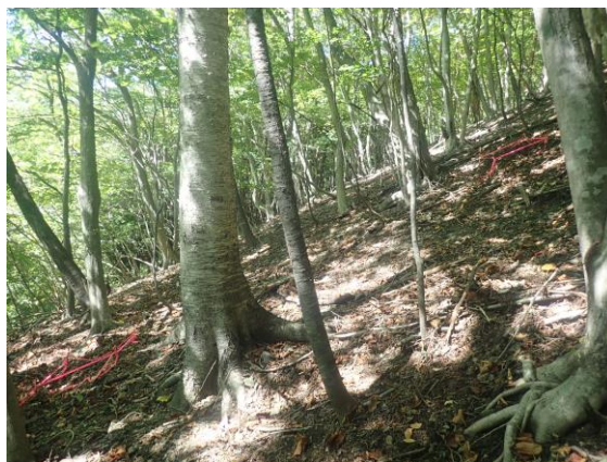
第18回調査時（2025年10月3日）