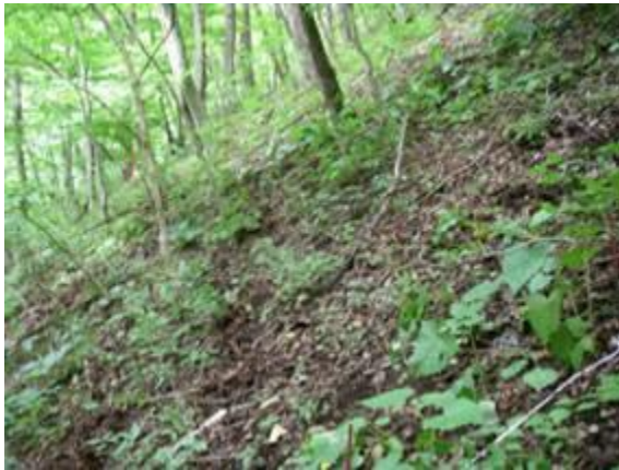
第1回調査時（2007年8月23日）