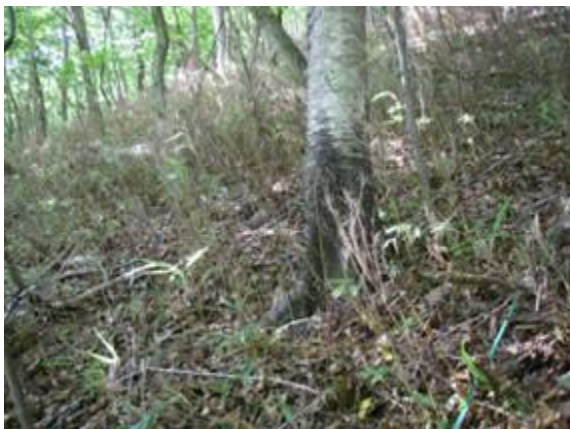
第1回調査時（2007年8月22日）