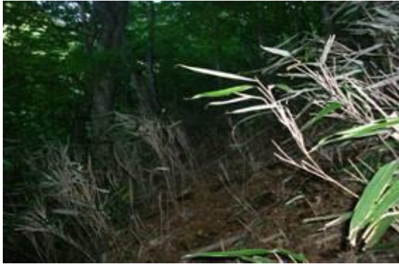
第 1 回調査時（2007 年 8 月 22 日）