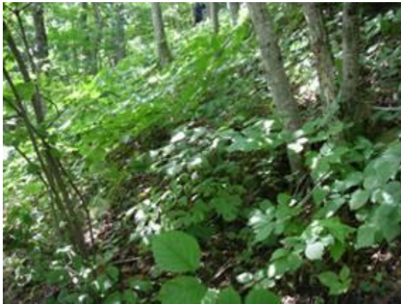
第1回調査時（2007年8月23日）