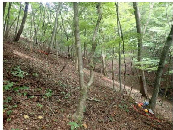
第17回調査時（2025年10月2日）