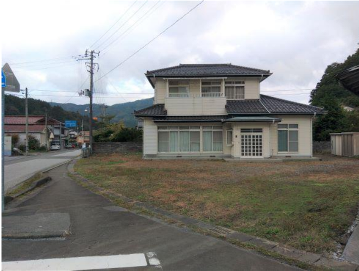
外観・駐車スペース