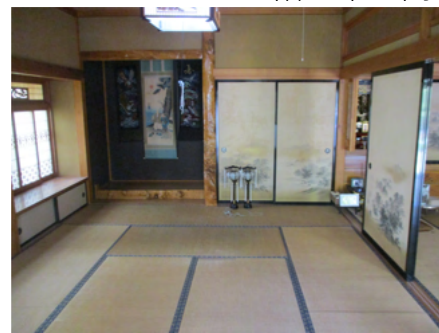
1階 和室 (10畳)