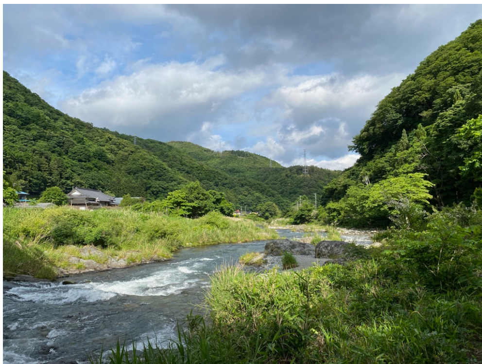
物件周辺の眺め（鮎釣り漁が盛んな気仙川）