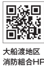
大船渡地区消防組合HP