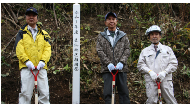
▲会場には記念標柱が建てられました