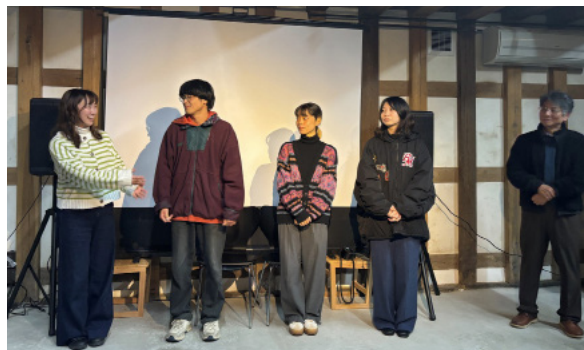
▲制作陣のこれからの活躍を応援しています

上映後は、映画の話の続きが会場内で演劇として披露され、来場者は、プロの演技に見入っている様子でした。