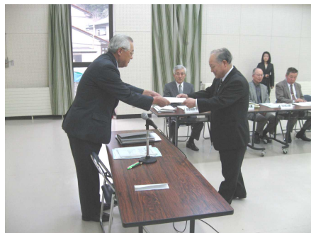
推進委員への委嘱状交付

その他、今年度計画・町統一テーマ(上記)が決定し、放課後子ども教室2年目の実施についても、具体的計画が承認されました。