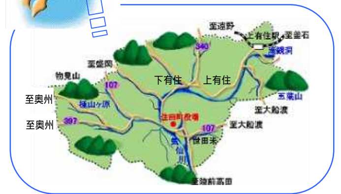
写真で見る 住田町