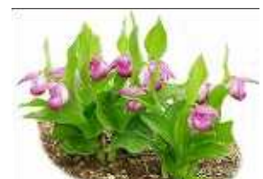
町の花「アツモリソウ」