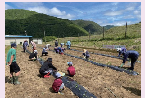
子どもたちとサツマイモの植付け