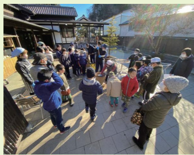
地域の達人事業 餅つき