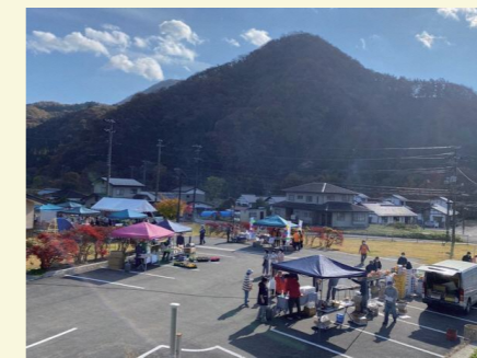
秋に開催するフリーマルシェ

当初は、遊休農地を活用しながら仮設団地住民との交流を目的に始まった蕎麦作り事業が、今では、みんなで作る地域を目指す主軸の事業として成長中です！