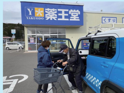
買い物をサポートするツアー

大人と子供が交流することで、子供たちのコミュニケーション力の向上につながっています。対話により地域の一体感を感じます。