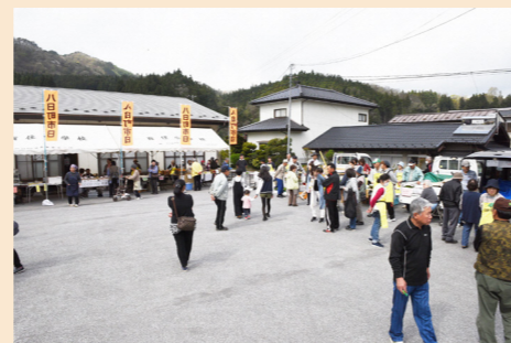
春と秋に開催する八日町市日

コロナ禍でも実施可能な事業のあり方を議論しながら、特色ある取り組みを進めてきました。新しい公民館での市日の復活を目指します。