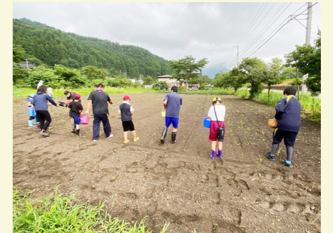
多世代で行う蕎麦の種まき