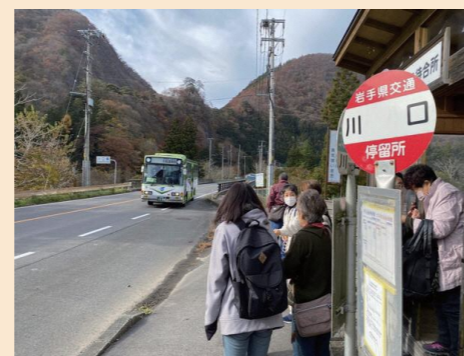
路線バスの乗車体験ツアー