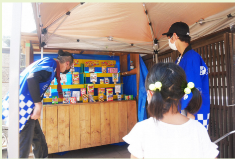
ちびっこなつまつりの射的

子供向けイベントでは、年配のスタッフたちもやる気に満ちていて、地域に活気が出たように思います。