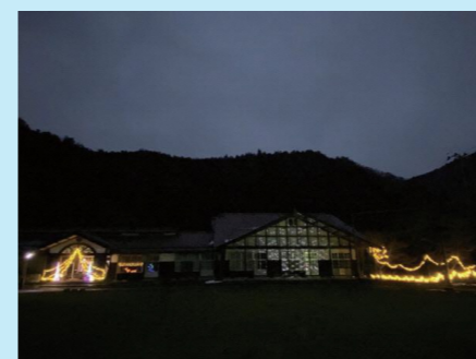
公民館を飾るイルミネーション