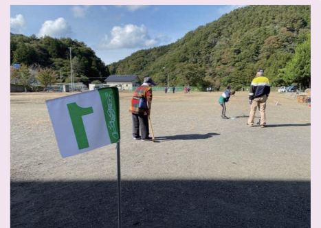
会話の弾むミニ運動会

休耕田の整備が始まって以来、継続的に参加者が増え続け、徐々に地域の核になりつつあります。商品化で地域の小遣い稼ぎを目指します。