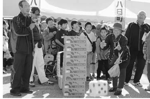
▲多くの人で賑わう八日町春日

○八日町春日の開催 上有住集会所を会場に地区住民らが出店。新たな品目開発など、市日の拡大に向けた活動を行いました。 ○地元再発見マップツアーの開催