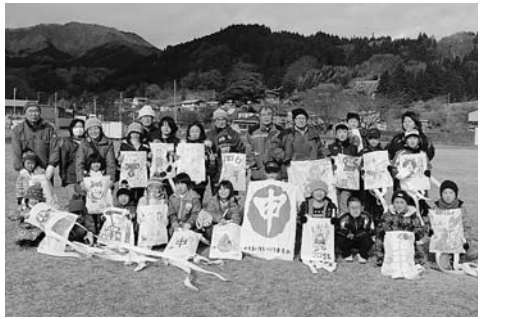
▲世代間の交流も図られました

平成24年度に策定された地区別計画を推進するための事業である「地域づくり推進事業」について、昨年度、事業を活用した3地区の活動実績をご紹介します。