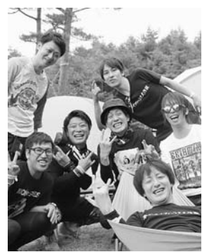
▲気仙ロックフェス最高!

フェスには、人気の国内トップアーティスト18組が出演し、2日間で約5000人の観客が参加。種山ヶ原の雄大な自然の中で、アーティストの熱い演奏に野外イベントならではの一体感を共有していました。山形県から参加した住田出身の男性は「今年で5回目の参加です。KRFは何もかもが良く、地元が誇れる日本一のフェスだと思っています。もっといろんな人に知ってほしい」と訪れた仲間とともに笑顔で語ってくれました。