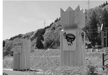
国体開催まであと 65 日