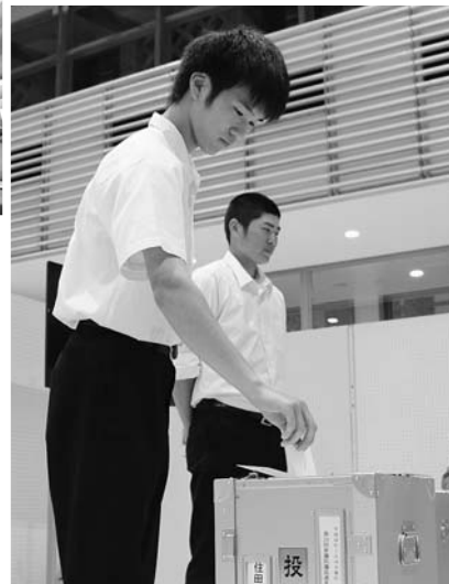
▲高校生もはじめての投票に緊張

7月10日に第24回参議院議員通常選挙が町内17か所の投票所で行われました。本町の投票率は、63・31%（当日の有権者数5162人）で前回の参議院議員選挙と比較すると、2・93%の減となりました。また、今回の選挙から選挙権の年齢が引き下げられるなど選挙制度が大きく変わり、高校生などの10代も日本の在り方を考える機会となる重要な選挙となりました。