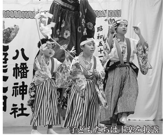
子どもたちは土楽を披露