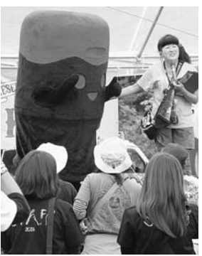
▲住田の人気キャラ「すみっこ」も登場