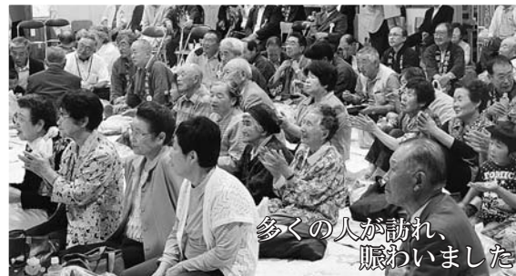
多くの人が訪れ、賑わいました