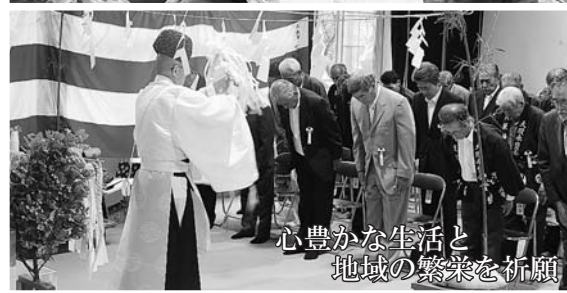
心豊かな生活と地域の繁栄を祈願

7月17日、大股地区の合同例大祭が13年ぶりに行われました。この合同例大祭は、平成15年まで八坂神社(大股)、八幡神社(中井)、山の神社(津付)の3神社で行われていましたが、少子高齢化などの影響により途絶えていました。しかし、大股を次世代に伝えたい、知ってもらいたいという思いから従来の3神社に宇南大権現社(小股)を加え、今回復活したものです。 大祭では、神事に続き、伝統の大股神楽が奉納されました。会場は、歌や踊りの披露に笑みがこぼれ、13年ぶりの大祭の賑わいに溢れていました。