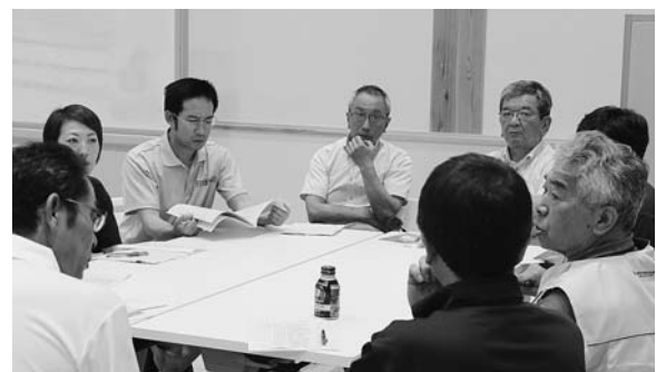
▲具体的な運営内容が協議されました

その後、2月の設立からこれまでの取り組みの報告や今後のスケジュールを確認しました。