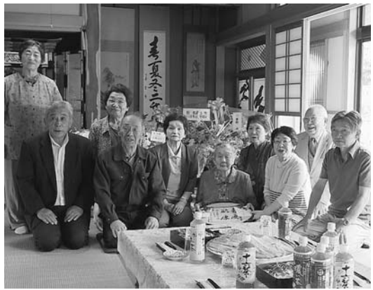
▲家族に囲まれての祝福に笑顔のナツさん