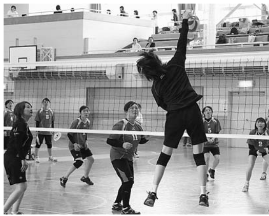
▲つないだトスを決める華麗なスパイク

7月3日、町生涯スポーツセンターで第47回家庭バレーボール大会が開催されました。大会には、町内9チームが参加し、熱戦が繰り広げられました。会場には、家族も応援に駆けつけ「ママ、ガンバレー!」と大きな声援が響きました。決勝は、曙チームと中沢チームが対戦し、中沢チームがセットカウント2-0で優勝を果たしました。