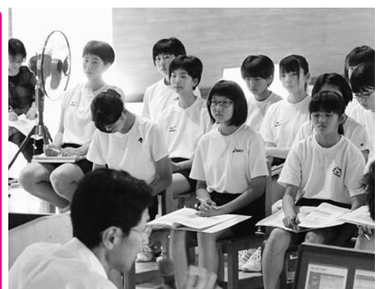
▲危険箇所をハザードマップで確認