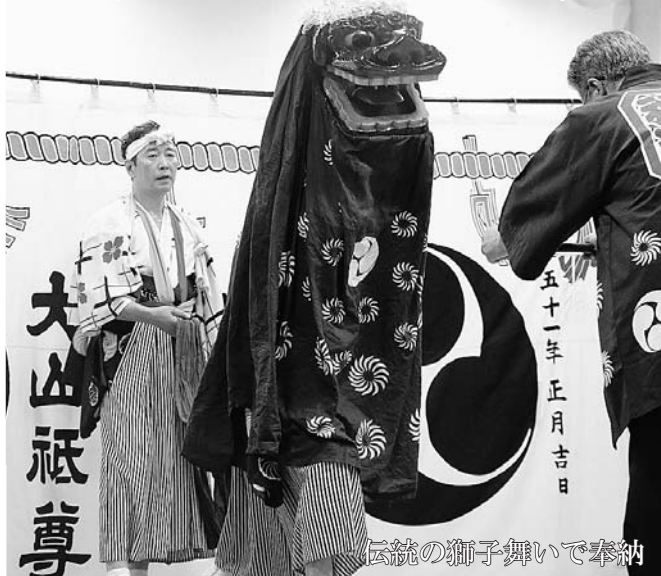
伝統の獅子舞いで奉納