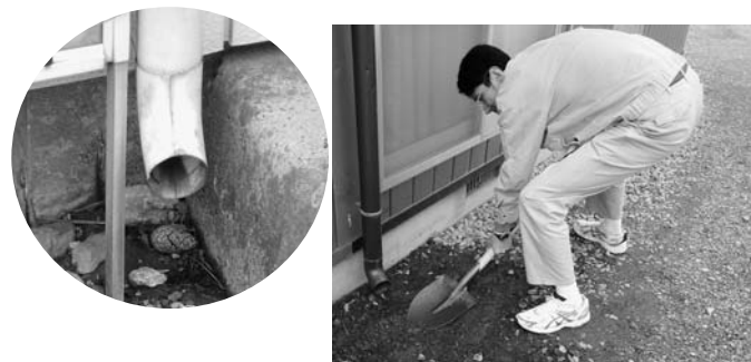
土を掘り、天地返しすることで効果が得られます

放射性物質は地表から数センチメートルにほとんどが存在しているので、表土を(たとえば、10センチメートル)削り取り、人の出入りの少ない場所に保管するか、下層の土と入れ替えること(天地返し)で、放射線量を大きく下げることができます。