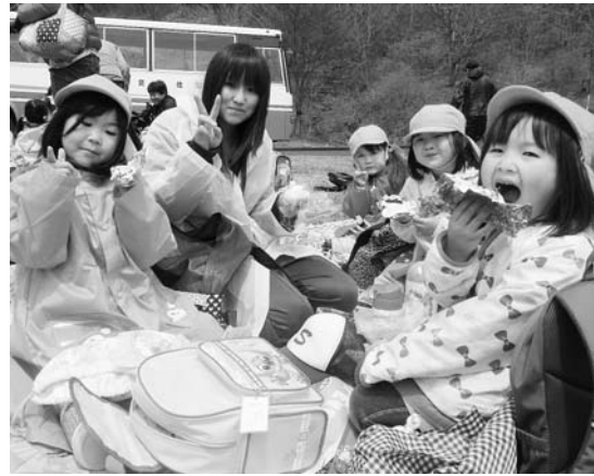
▲楽しそうにお弁当を食べる園児たち

5月11日、種山ヶ原森林公園で、森の保育園が行われ、世田米保育園の園児が散策や自然との遊びを満喫しました。この日は、すみた森の案内人をガイドに、年長児19人と職員らが参加。また、住田高校の生徒がボランティアとして協力しました。時折小雨がばらつき、冷たい風が吹き付けるあいにくの天候となりましたが、子どもたちは終始元気な様子で、ネイチャーゲームや岩登りなどを楽しんでいました。昼食では、みんなで輪になり、「お外で食べるのはおいしいね」と話しながら、笑顔でおにぎりなどをほお張っていました。