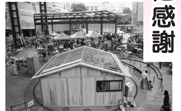
▲モア・トゥリーズの支援により六本木ヒルズで行われた仮設住宅の展示イベントの様子

だけでなく、森林保全や林業振興に向けた支援までして頂き、そのありがたさは計り知れない。頂いた支援金は意に沿うよう、木造仮設住宅の費用に使わせていただきました。と謝辞を述べました。