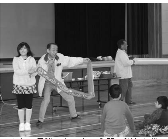
▲あら不思議。あっという間に膨らむ袋