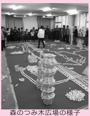
森のつみ木広場の様子

▼森のつみ木広場 ▼読み聞かせ会、人形劇 【対象】 町内在住の乳幼児 (0～5歳児)、小学生とその 保護者 ※保護者同伴で参加願いま す。