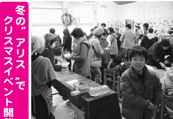
▲来場者で賑わう「B級グルメ決定戦」

12月22日、旧下有住小学校校舎を会場に「アリスの不思議なクリスマス」が開催され、多くの来場者で賑わいました。 イベントでは、町のマスコットキャラクターを決める総選挙をはじめ、「冬のおぼけ屋敷」、音楽サークル「音蔵」によるクリスマスコンサートなど多彩な催しが行われました。このうち、住田のB級グルメNo.1を決める「勝手にB級グルメ決定戦」では、豆乳を使ったクラムチャウダーや、地元産の鶏肉をパジルと塩で味付けた唐揚げなど、味自慢の一品を用意した4団体が出店。会場内にはいい匂いが漂い、来場者はお気に入りのグルメに一票を投じていました。