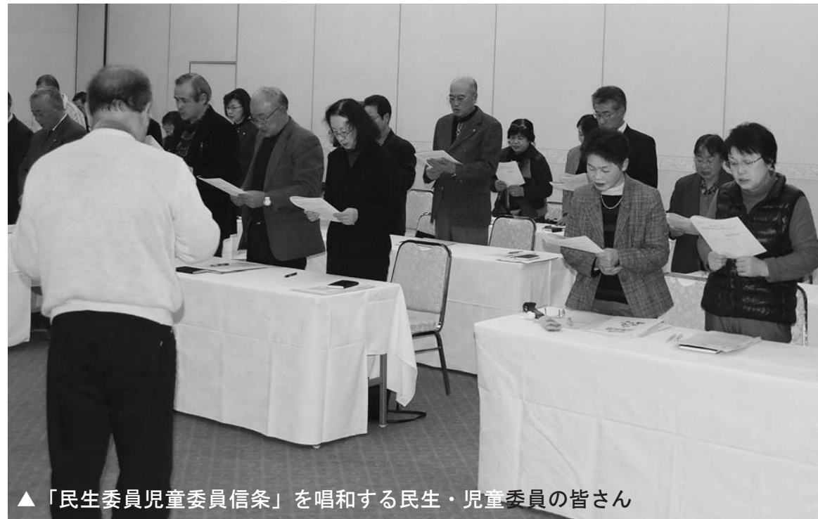
▲「民生委員児童委員信条」を唱和する民生・児童委員の皆さん