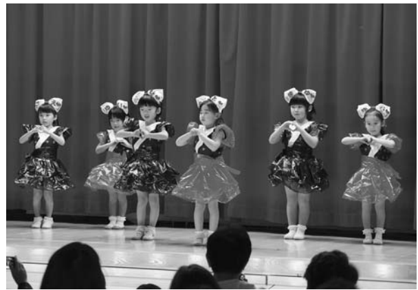
▲可愛い衣装と踊りで会場を魅了（世田米）

11月28日と12月7日、町内の保育園で生活発表会が行われ、この日のために歌や踊りを練習してきた園児たちの堂々とした発表に、会場からは惜しみない拍手が送られていました。 11月28日に行われた世田米保育園の生活発表会では、4歳児のぼなな組の女の子たちが、本年、人気を博したドラマ「あまちゃん」の劇中曲「潮騒のメモリー」にあわせ、踊りを披露。女の子たちの可愛らしいしぐさに会場内はすっかり魅了されていました。