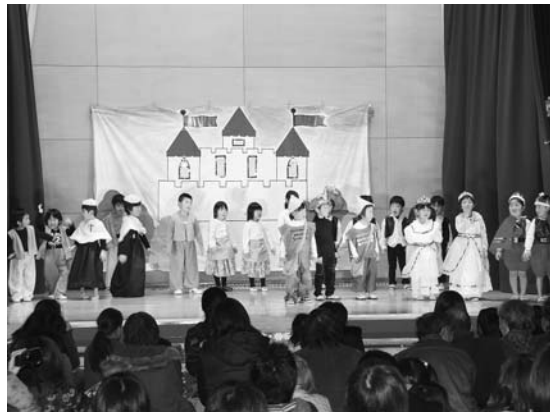
▲園児が堂々とした演技を披露（有住）

一方、有住保育園の生活発表会は12月7日に行われ、5歳児のぞう組と4歳児のぼんだ組の園児たちが、劇「金のガチョウ」を発表しました。園児たちは、演技だけでなく、歌や踊りを織り交ぜた多彩な劇を披露。舞台では、元気いっぱい動き回り、それぞれが演じる役になりきるなど、大人顔負けの演技を見せていました。 どちらの会場も大きな盛り上がりを見せ、集まった保護者らは子どもたちの一段と成長した姿に目を細めていました。