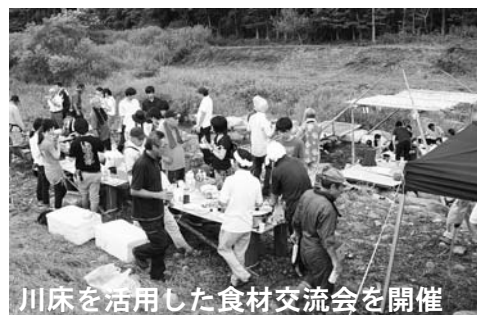
川床を活用した食材交流会を開催