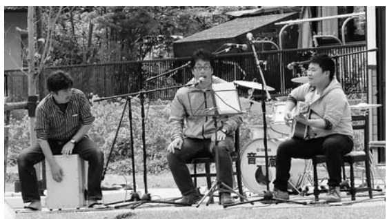
▲音楽で町おこしを目指す団体「音蔵」

▽ 補助金の交付決定 申請者が事業の提案説明を行う審査会を開催し、その審査結果に基づき、町長が補助金の交付決定をします。