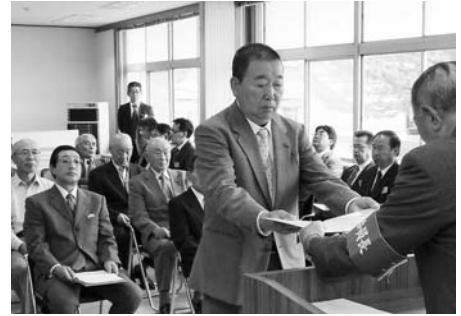
▲当選証書付与式の様子