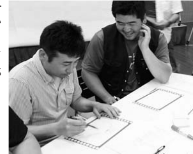
▲CM制作に取り組む参加者

ワークショップでは、団体の情報発信をテーマに、各団体の活動内容を町民に広く伝えるためのコマースィヤル制作を企画。参加者は、それぞれの団体のイメージやPRポイントを盛り込んだコマースィヤルを作ろうと、用意された紙にイメージをまとめました。その後、完成した全ての作品を一齐に並べ、各団体ごとに説明を行うなどして、お互いのイメージを確認し