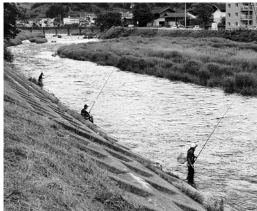
▲町内外から多くの人が訪れた気仙川

また、「ブロイラー生産は、いかに鶏に快適な環境を提供できるかが鍵。1羽ごとの個体差や、天気の変化など自然環境への対応など、気が休まる時が無い中で、ともに努力してくれた家族の協力があつたからこそ、成績につながったのだと思います」と、家族への感謝の気持ちも表していました。