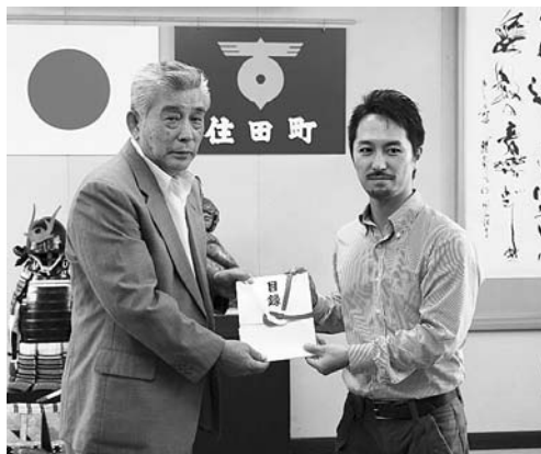
▲多田町長に目録を手渡す水谷事務局長