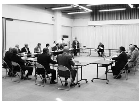
▲役員選出を行った第1回総会

7月22日、改選後初めての農業委員会総会が町農林会館で開催され、当選者13人のほか、大船渡市農業協同組合、東南部農業共済組合、町議会から推薦された3人も加えた16人全員が出席しました。