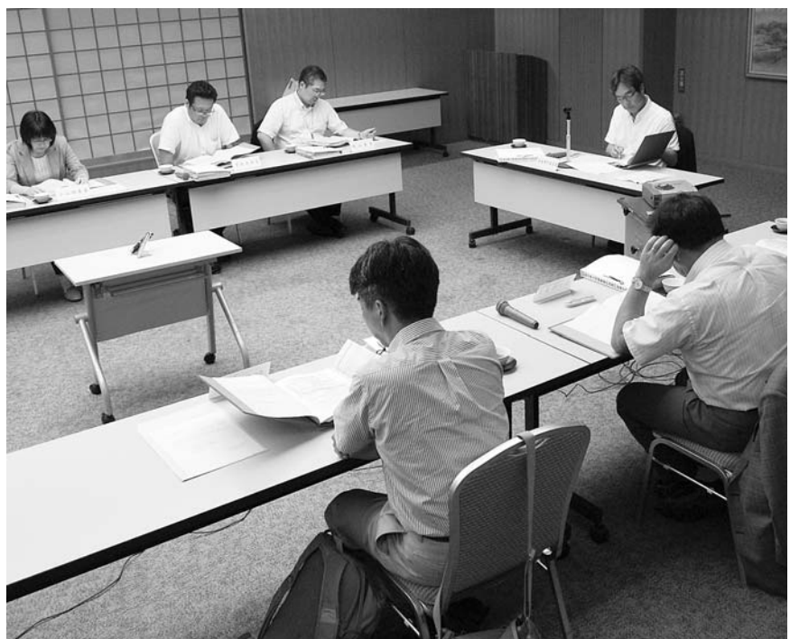
▲津付ダム建設事業中止の答申を出した大規模事業評価専門委員会

なお、津付ダム建設事業の中止は妥当であるとした答申書は、17日に政策評価委員会より県知事あてにすでに提出されており、県では今後、最終的な判断をすることとしています。