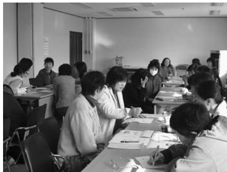
今年度の講座を振り返り、成果と課題を話し合いました

女性リーダー中央講座第5回学習会は11月28日、生活改善センターで行われました。今年度最後となる学習会には27人が参加。子育ての講演会・地球温暖化等の環境学習・県立博物館見学・種山ウォーキングを行ってきた1年間を振り返り、視野が広がり自分みがきの場となった。など成果を話し合い、学んだことを近所の人に教えるなど、地域に還元することが必要」など、今後の課題を確認しました。今年度5回の学習会には54人、延べ146人が参加。5回全ての学習会に参加した4人には、皆勤賞が贈られました。