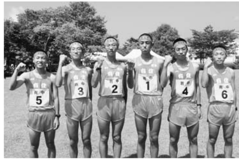
6連覇を果たした有住中男子

競技は同センター運動広場から気仙川防波堤沿い道路を周回するコースで、男子17チーム、女子15チームが出場し、男子は6区間18キロ（各区分3キロ）を、女子は5区分12キロ（1、5区分は3キロ、2、4区分は2キロ）で県大会出場を目指して競われました。