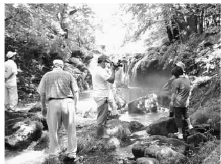
別当大滝を見学する参加者

昼食会場となった西野搦き屋では、米つきの実演を見学し、また、地元のお母さんたちが準備した、みそ田楽やきび団子