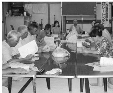
熱のこもった議論が交わされる

も含めた地域活動を、より活性化するためにはどうすべきか」との問題が提起され、「活動の意義や目標を、参加者同士で共有していくことが大切」「町づくり全体のビジョンについて、より議論を深めるべき」といった意見が出されました。 また、青空市への地区としての関わり方、子ども遊び場の確保なども課題として取り上げられるなど、会場内では、終始、熱のこもった議論が交わされました。