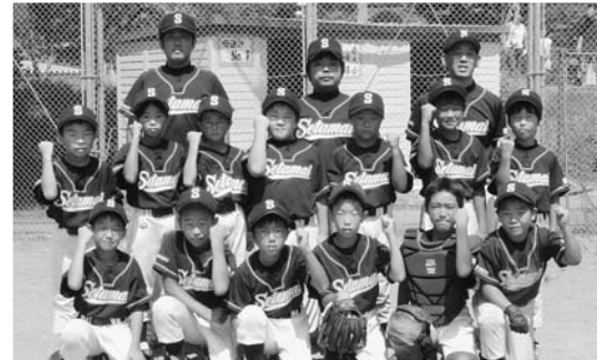
県大会出場を決めた世田米野球スポ少

8月21日、世田米小学校グラウンドで岩手県野球協会会長旗学童新人野球大会の町予選が行われ、世田米、有住両スポ少の新人チームが対戦した結果、世田米野球スポ少が乱打戦を制し、1点差で勝利し、県大会の出場を決めました。 試合結果と世田米野球スポ少のメンバーは次のとおり。