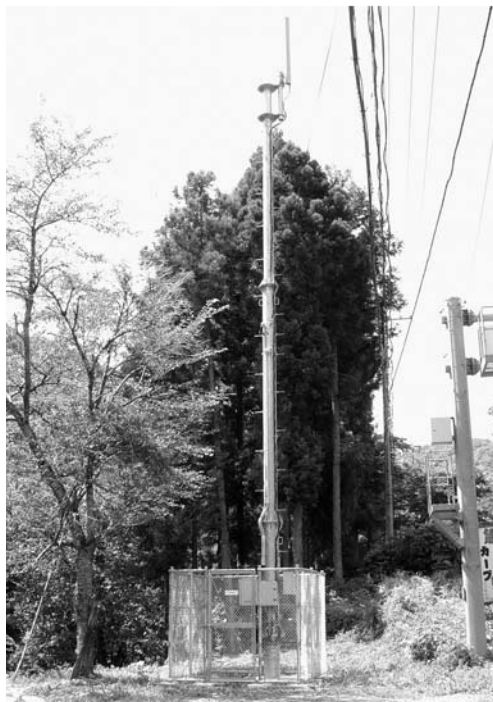
整備した携帯電話の鉄塔（柏里）

域を残すのみとなりました。今後も携帯事業者に積極的に要望活動を引き続き行い、不感地域の解消を図っていきます。