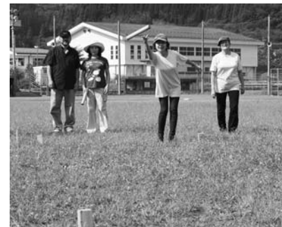
2年前に本町で開催された全国レクリエーション大会での様子

◆開催場所 住田町運動公園 ◆募集人数 12チーム 約80人 ◆参加費 1人 500円(当日受付へ) ◆申込方法 申込書に必要事項を記入して担当へ提出してください。 ◆申込締切日 8月31日(火) ◆問い合わせ 産業振興課 林政係 ☎46-3861(内線322)