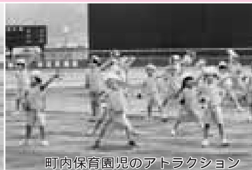
町内保育園児のアトラクション