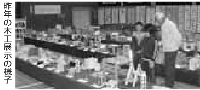
昨年の木工展示の様子