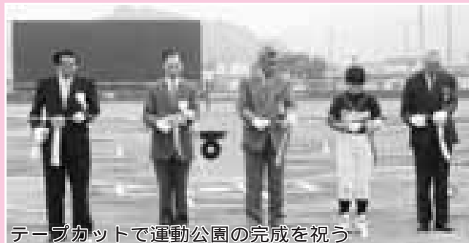
テープカットで運動公園の完成を祝う