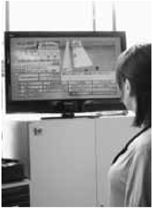
「地デジ」で快適な生活を...