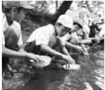
「あっ光ったよ!」「砂金かな?」