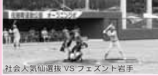
社会人気仙選抜 VS フェズント岩手