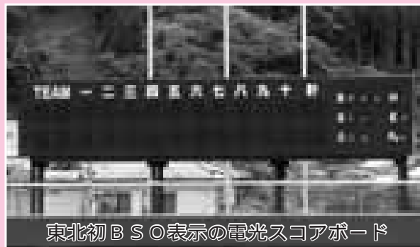
東北初BSO表示の電光スコアボード