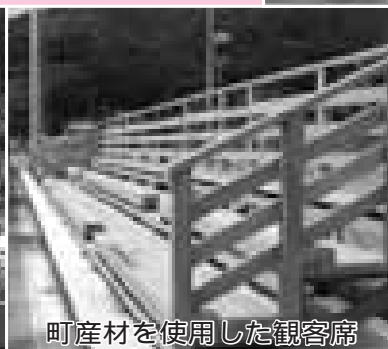
町産材を使用した観客席