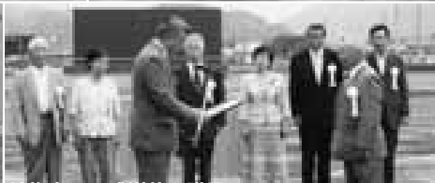
地権者らに感謝状を贈呈