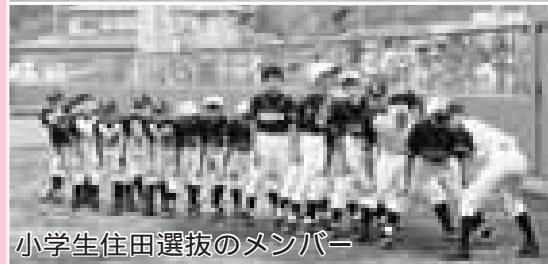
小学生住田選抜のメンバー