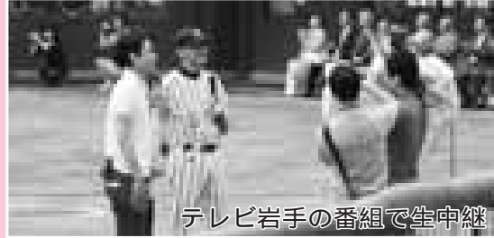
テレビ岩手の番組で生中継