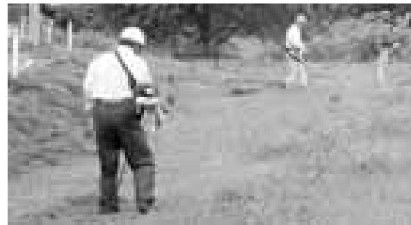
草刈作業に汗を流す参加者

▽せたまい まちづくり委員会 ■河川公園の清掃活動を実施しました 6月27日、川向河川公園とその周辺の清掃活動が行われました。 この活動は、河川公園を地区住民の憩いの場にしようとして、平成15年度から毎年、春と秋の2回行っているものです。 この日は、地区住民約60人が参加し、昭和橋から清水橋までの河川沿いを中心に、草刈作業などで汗を流しました。