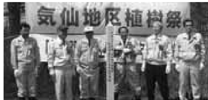
代表者が記念標柱を建立

4月30日、種山ヶ原森林公園イベント広場で平成22年度気仙地区植樹祭が行われました。 この催しは、各市町の持ち回りで毎年行われているもので、本町が開催地となった今回は、気仙の西の玄関口となっている種山ヶ原を気仙地区で