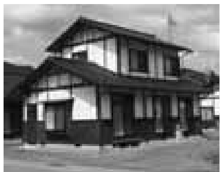
町産材で建てられている町営住宅

■補助対象者： 町民で町内に自らが居住する住宅を新築 町内の建築業者等に発注 町産材15立方メートル以上を使用 から の条件をすべて満たしている方が対象になります。