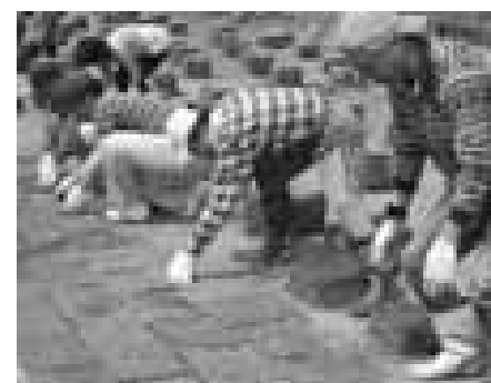
芝の植栽作業に汗を流す参加者

5月16日、上有住集会所センターで、八日町市日画推進協議会が、地域にかつての賑わいを取り戻そうと平成17年から春と秋の年2回、定期的に開催しているものです。 この日は、地域の人たちを中心に18人が出店し、タラノメやしどけなどの山菜、だんごや漬物などの加工品、山野草、豚肉野菜苗、伝統工芸品などが、店頭並びました。開店とともに町内外から多くの人が詰めかけ、会場内は終始、売り手と買い手の会話で賑わっていました。