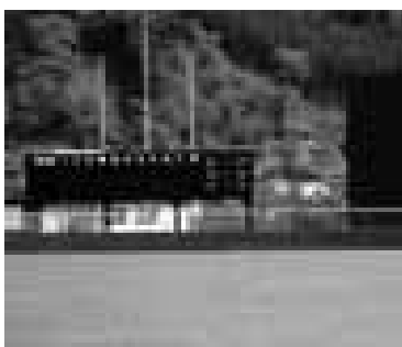
ラバーフェンスに広告を募集

■利用期間 ・原則として1年間（年度）としますが、年度途中から利用した場合は年度末まで。