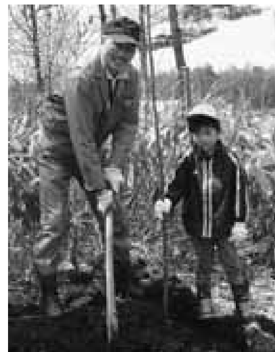
孫と一緒にオオヤマザクラの苗木を植える参加者

サクラを最後に見ることが出来る景勝地にしよう と行われました。 また「気仙郡」の名が歴史上に登場した弘仁元年(810年)から1200年の節目となることから、3市町連携の記念行事の第1弾として「気仙郡誕生1200年記念植樹」とサブタイトルが付けられました。 この日は、関係団体や各市町議会関係者など約