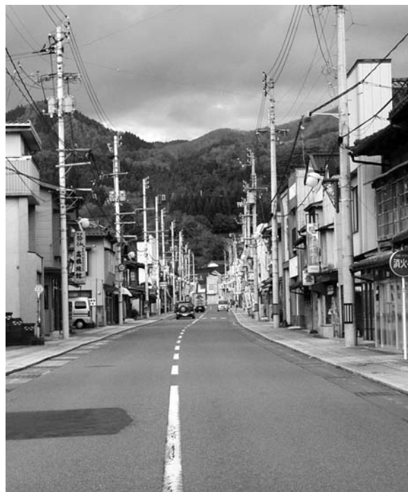
現在の世田米商店街の様子

1月8日、職員による第1回中心地域・中心商店街活性化構想検討委員会が開かれました。