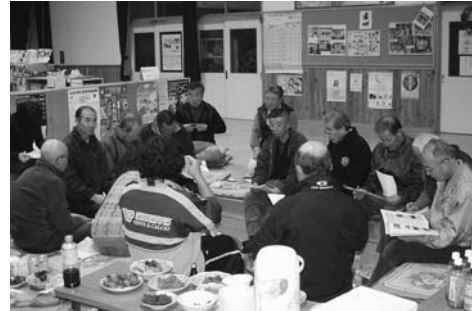
盛り上がった交流会

各地区代表者交流会 12月1日、地区別計画推進母体の各地区役員15人が大股地区公民館に集い、各地区の地域づくりや町づくりについて意見交換をしながら交流しました。