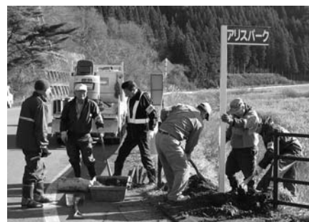
案内板設置に汗を流す会員

この日は、会員などおよそ15人が参加し、小松地内の県道釜石住田線沿いにあるシデの巨木「ソロの木」や地域住民の憩いの場として親しまれている「アリスパーク」など5箇所に、7本の案内