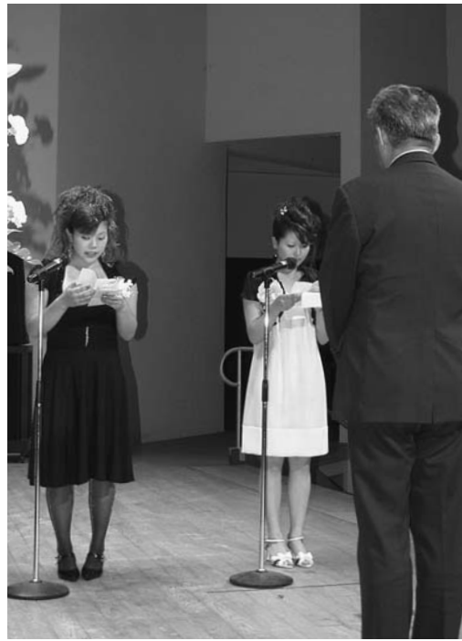
多田町長を前に「新成人の誓い」