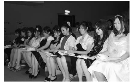
真剣な表情で話を聞く新成人

平成21年度成人式（町、町成人式実行委員会主催）が8月15日、農林会館で行なわれました。今年度から対象者全員が平成生まれとなり、華やかな衣装を身にまとった新成人67人が出席し、成人としての責任と希望を胸に、人生の新たな一歩を踏み出しました。