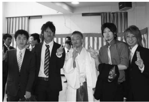
新成人の記念に「ハイ・チーズ！」

式典後に、農林会館のエントランスホールで「餅つき」が行なわれ、新成人が掛け声に合わせて餅を上手につくと参加者から歓声が上がりました。その後、多目的ホールに場所を移し、成人式実行委員会主催による「味わい知る、ふるさととすみな」と題した交流会が開かれ、町内の飲食店などの協力により、豚肉の冷しゃぶや鮎の塩焼きなど町内産の食材を使ったふるさとの味に舌鼓を打ち、久しぶりの再会に喜びながら近況を語り合うなど賑やかなひとときを過ごしました。