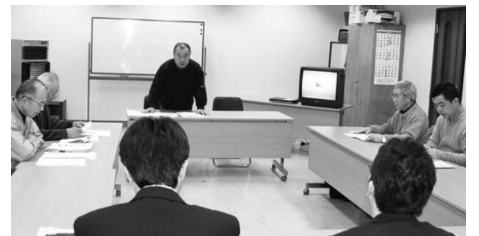
活発な意見交換が行なわれた放送番組審議会

事務局から、自主放送チャンネルの放送状況や番組内容の報告を受けた審議委員は「放送内容の公平性について問題はない」と一致した見解を示し、地域情報番組について「改善の余地はあるが初年度としては良かったのではないかと評価しました。」