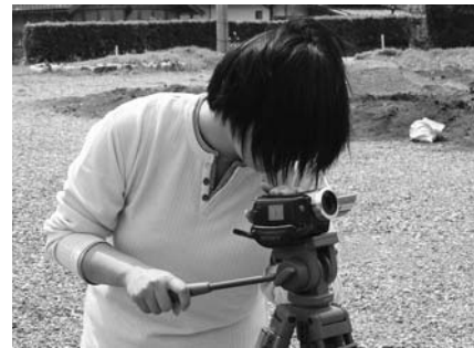
住田テレビの取材の様子

2年目に向け「放送番組審議会」や「町民アンケート」の結果、新しい取り組みなどを紹介します。