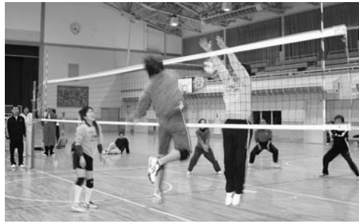
白熱した試合を繰り広げる選手たち

1月6日から生涯スポーツセンターを会場に「住田町長杯争奪バレーボール選手権リーグ」が行われ、熱戦を繰り広げています。 この大会は冬場の運動不足解消と選手との交流を目的に毎年開催されており、今回で27回目となります。 各チームリーグ戦の10試合を戦い、成績上位の6チームが3月8日に開催される決勝大会へ駒を進めます。