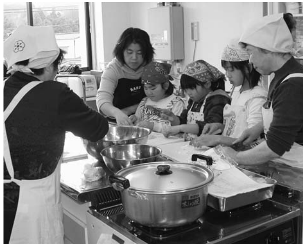
楽しく料理を作る児童たち

1月7日、保健福祉センターで「ふれあい交流クッキング」が開催されました。 この教室は次世代を担う子供たちに住田の安全・安心な食材を活用した食の体験などを通じ、生きる力を育む食環境作りを推進していくことと食生活改善推進協議会の協力のもと、冬休み中の町内の小学生と保護者を対象に行われ、児童や保護者約30人が参加し、家族一緒に楽しむ食事「テーマに清流豚の手作り餃子」や「野菜たっぷり中華風スープ」づくりに挑戦しました。