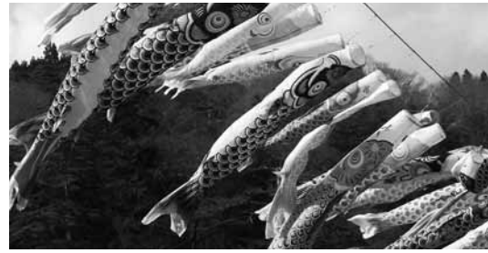
清水橋の風に泳ぎ爽快な鯉のぼり