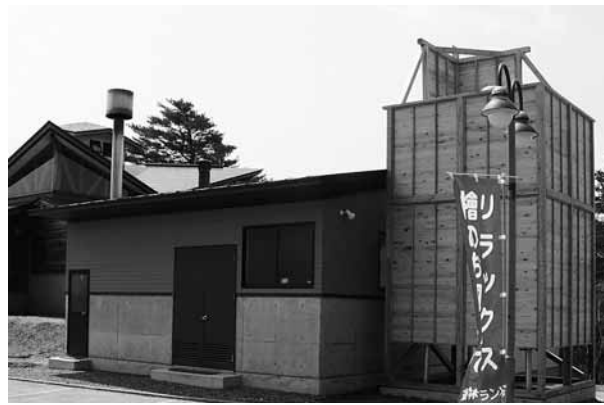
地球環境に優しいペレットボイラー

遊林ランド種山のお風呂のボイラーが、四月から木質バイオマスエネルギーに変わりました。環境と経済の好循環を実現し、その取り組みを普及させることを目的とした、環境省の「環境と経済の好循環のまちモデル事業」でペレットボイラーを導入したものです。 熱利用が効率的で、地球環境に優しい木質バイオマスエネルギーのお風呂は、お湯がやわらかく、湯上りに肌にピリッとする感触がなく体が温まる。」と来場者になかなか好評なようです。