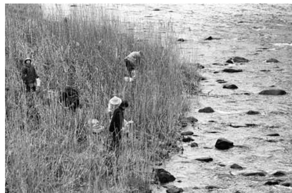
川沿いでごみ拾いや草刈作業をしました

四月十五日に町民総参加の気仙川一斉清掃が行われました。小雨の降る中、伸びた草を刈ったり、川に浮いているビニールを濡れながら拾ったりと多くの人たちが作業に汗を流しました。川岸には、空き缶や、コンビニ袋にまとめてある弁当などのごみ、農業用ビニール、発泡スチロールなど様々なものがありました。参加者は、集めたごみを事前に配布された専用ごみ袋に分別し、近くのごみステーションに持ち寄りまし