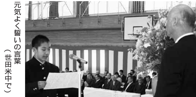
元気で誓いの言葉 (世田米中で)