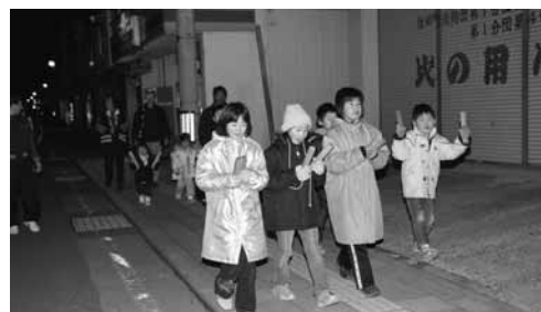
大きな声で防犯・防火活動する子どもたち

曙地区の小学生が、一月八日から十二日まで世田米商店街を練り歩き、地域住民に防犯と防火を呼びかけました。最終日の十二日は児童七人のほか、地区民と保護者数人が参加。夜八時に天照御祖神社前をスタートし、地区商店街を回りました。 子どもたちは、「戸締り用心。火の用心」と寒空の中、大きな声で呼びかけていました。