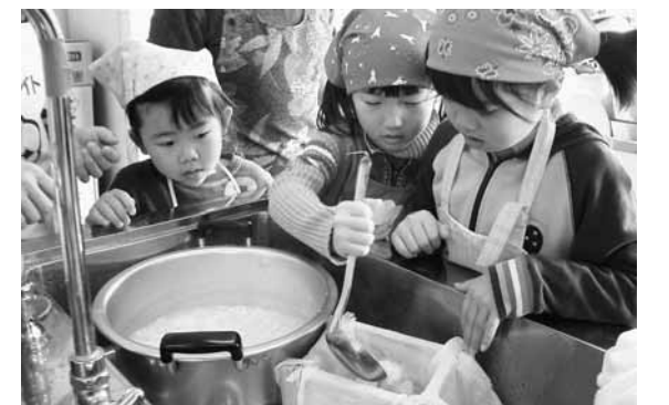
子どもたちもおいしい豆腐を作りました

町内の児童と高齢者による料理教室「ふれあい交流クッキング」が町内各地区で開催され、「手打ちそば」と「豆腐」作りを通じて世代間交流を図りました。 子どもたちは、はじめて豆腐作りに挑戦。大豆から豆腐になる過程にみんなびっくり。水切りをして出来上がった豆腐を口にすると、「すごくおいしい」と大満足。世代間交流を深めながら、美味しい豆腐を味わいました。