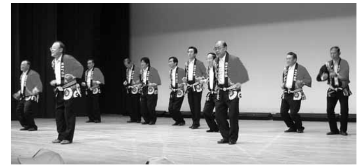
議会議員による踊りに会場も「ハッスルハッスル！」