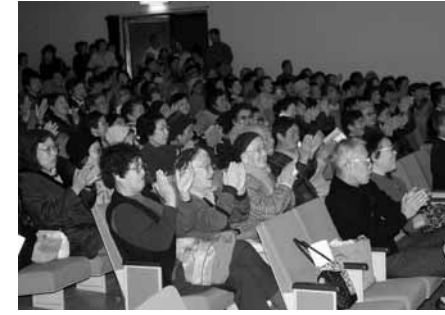
演目が終わるごとに、会場からは惜しみない拍手が送られました