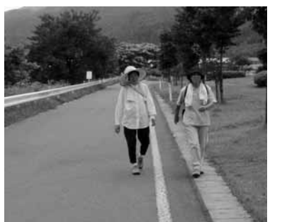
ウォーキングしている風景

高まる運動の必要性 健康づくりのための三本柱として「栄養・運動・休養」が挙げられます。 わたしたちの日常生活は、移動手段の発達や労働の機械化などにより、簡単に便利な時代になりました。また、飽食の時代になり、近年ますます「運動」の必要性が叫ばれています。国でも「健康のための運動」