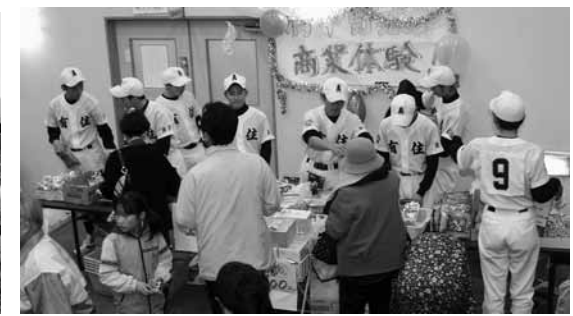
有中野球部員による商業体験「百円市」元気な呼び込みの声が来場者を迎えました