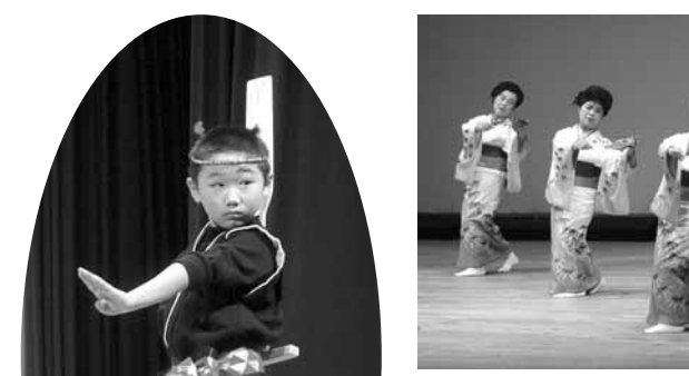
息もぴったり（華の会）