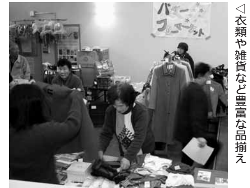
衣類や雑貨など豊富な品揃え