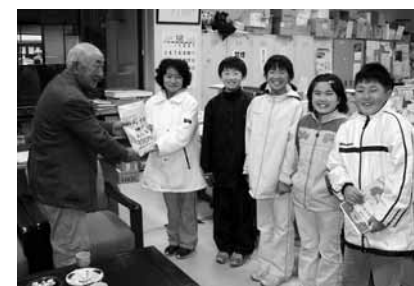
たくさんの善意に感謝します(写真は上小児童会役員の皆さん)