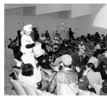
盛大な「菓子まき大会」で締めくくりました