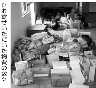
▽お寄せいただいた物資の数々