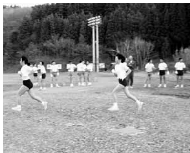
ゴールを目指す生徒に声援を送る

「カエルコース」は、カエルやクジラのように、自然の地形を利用した、トレーニング中最も厳しいと言われる往復約一、八六〇mのコースです。ウォーミングアップが終わると全員が一斉にスタート。校舎の裏手を回り田んぼのあぜ道を通ります。そこから上有住城址に続く山道へ。歩くのも容易でないほどの急な坂道です。頂上に着くとそこから一気に駆け下り校庭のゴールを目指します。