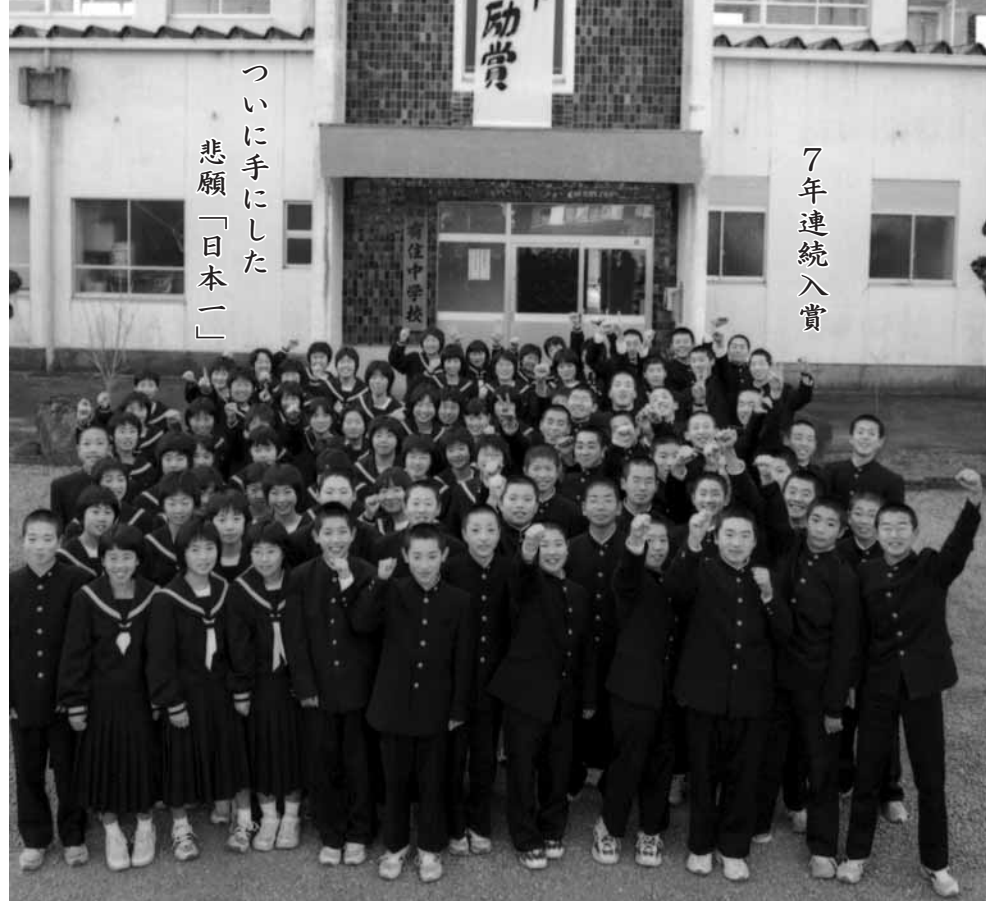
7年連続入賞 悲願「日本一」 ついに手にした

「第十八回毎日カップ中学生体力づくりコンテスト」で有住中学校が最高位の文部科学大臣奨励賞を受賞しました。七年連続受賞の末に手にした栄冠に、生徒や教師のみならず、父兄や地域住民も喜びに沸いています。