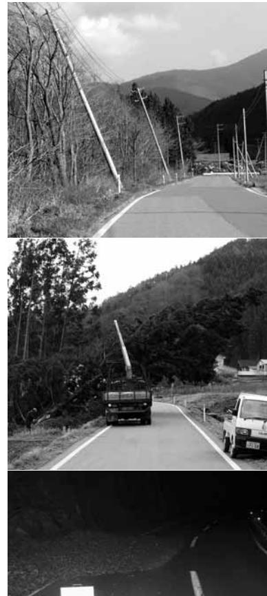
(上)暴風で傾いた電柱=下寒倉=(中)なぎ倒された大木=小台=(下)道路脇に吹きだまりになった落ち葉=子飼沢

この風は二十六日の夜から勢力を増し、午後九時五十五分には沿岸南部に暴風警報が発令されました。二十七日午後四時二十四分に警報は解除され、その