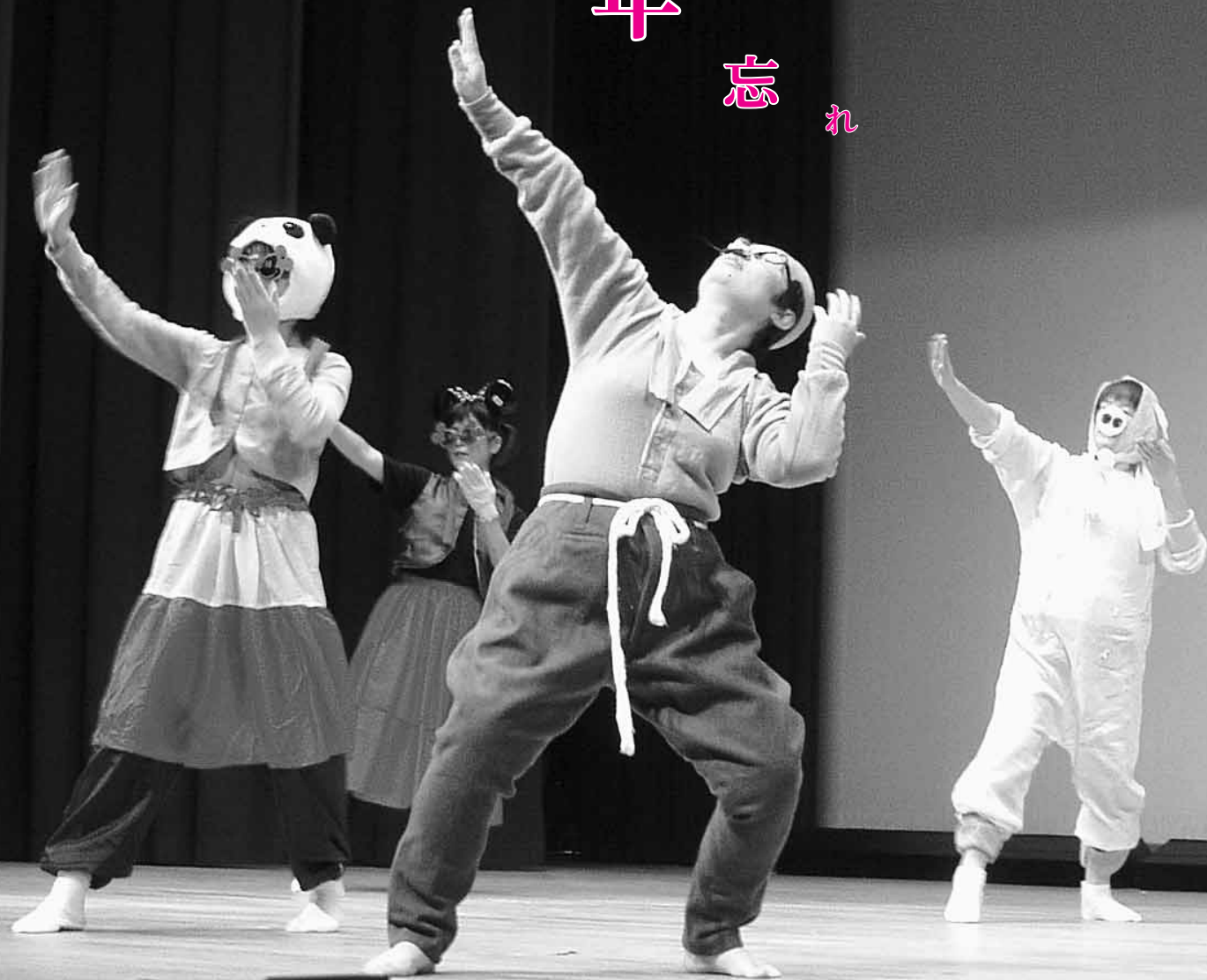
12/5 町歳末たすけあい芸能祭での1コマ（外館甚句） （関連記事6ページ）