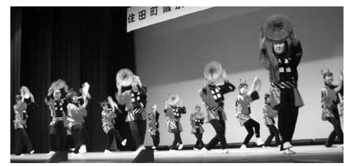
愛宕婦人部の「花笠音頭」には地域の男性2人も参加