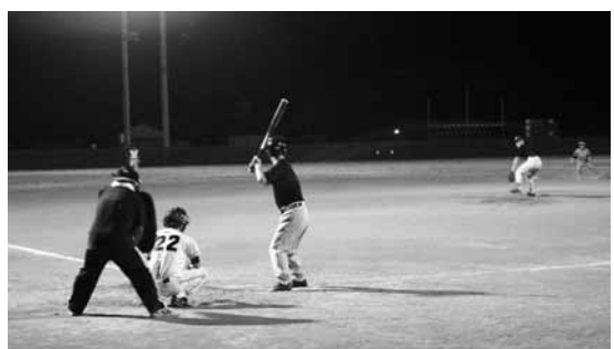
野球で汗を流し、暑い夏を乗り切りましょう

住田町ナイター野球協会小松久平会長の第十九回ナイターリーグが、七月一日に開幕。今年是一般の部に七チーム、OBの部に五チームが参加。九月中旬まで熱戦が繰り広げられる予定です。出場チームは次のとおり。 【一般の部】 あぶさん 大股体育協会 バツカス 有住キングス 獣王会 Sumita。 両向のん べいず みちのくタイガース 【OBの部】 下在OB 曙OB 大股体協 OB 上有住OB 愛宕OB