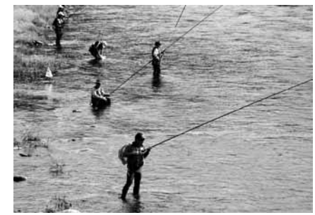
前日は泊り込む人の姿も多く見受けられました（写真は昭和橋付近）

アユ漁解禁の七月一日には、多くの太公望たちが早朝から気仙川に竿を連ね、久々の感触を楽しみました。全く釣れない人や数時間で三十匹ほどを釣り上げる人など、釣果はさまざま。今年も釣り人たちの熱い「戦い」が繰り広げられることでしょう。