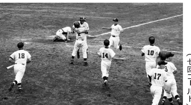
▷盛岡農戦、十一回裏住田一死三塁、国井（2年）の中前打でサヨナラ勝ちを収め、喜ぶ住高ナイン

◆第八十六回全国高校野球選手権岩手県大会（七月十五日～） 一回戦（県営野球場） 住 田3 2 盛岡農 二回戦（延長十二回） 住 田5 0 遠野情報 三回戦（零石球場） 住 田4 3 岩谷堂 四回戦（県営野球場） 住 田0 7 専大北上 （七回コールド）