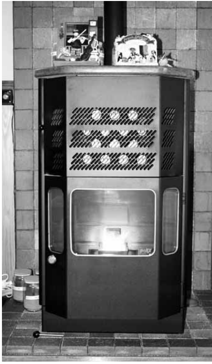
（右）ペレットストーブを購入する際の町からの補助金を予定しています （下）ペレットストーブやペレットボイラーが普及すると、本町のペレット消費量も増え、経済効果が期待されます

③発電施設整備事業 （平成十七年度） 木工団地内の各工場の電気をまかなうために、平成十六年度に整備した木屑焚きボイラーに発電施設を整備し、二酸化炭素の排出量を削減します。 ④園芸ハウス実証導入事業 （平成十七年度） 木屑焚きボイラーから発生する熱を園芸ハウスに利用するための実証試験施設の配管部分に対して町が補助します。実証結果を踏まえて、近隣のハウスへ熱を供給し、灯油ボイラーから切り替えます。