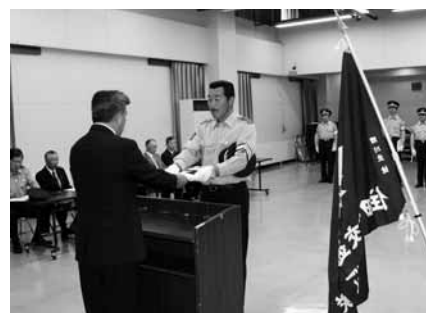
多田町長(左)から辞令を受け取る隊員