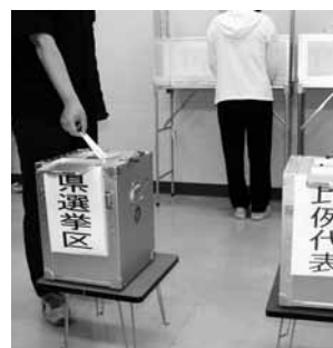
期日前投票の様子

第二十回参議院議員通常選挙は七月十一日に投票日を迎え、町内十九カ所の投票所で投票が行われました。本町の投票率は岩手県選出議員選挙が六九・八四%(前回比一・八七ポイント減)、比例代表選出議員選挙が六九・八一%(前回比一・八九ポイント減)と、どちらも七〇%を切る率となりました。