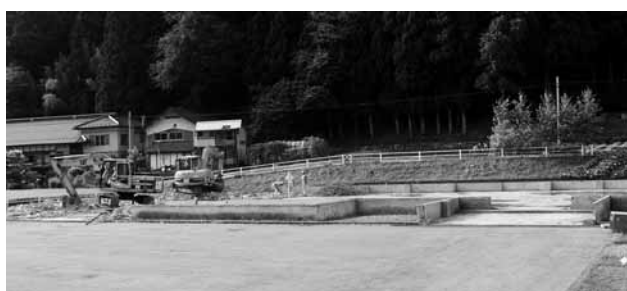
新しい給食センターの建設予定地である旧たばこ収納所(小府金)は、現在解体工事が進んでいます

建物改築の契約金額が八千三百七十五千円、機械設備工事の契約金額が一億四百七十九千円それぞれ可決されました。