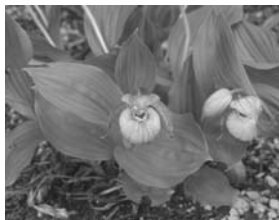
(13) 平成16年5月25日 広報すみた

先月号の広報すみたのクイズ、皆さんはおわかりになりましたでしょうか？ 正解は下の写真の「アツモリソウ」でした。 今年もきれいな花が咲きますように。