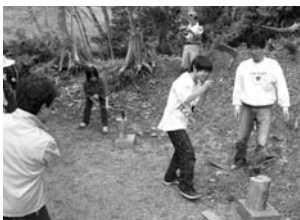
狙いを定めて「えいっ」

●今まで何度か住田町に来た事はあったのですが、何をどのように楽しめばいいかわからなかった。今回いろいろ楽しい所が分かった。で良かった。住田町は初めて知ったけれど、楽しく過ごせて良かった。(町民の皆さんがとても親切にしてくれたので)