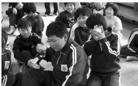
氷の気泡が奏でる美しい音に耳を澄ます児童たち