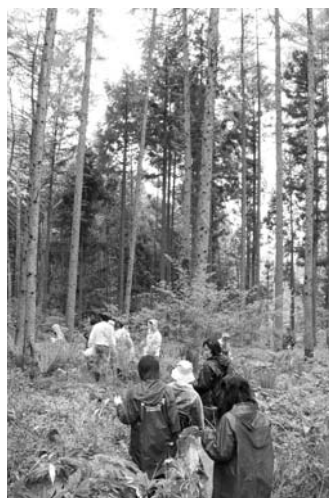
山菜を求め山を歩く

●山が近く、田んぼや畑も近くに感じられ、のどかで良かった。大事にしてほしいと思います。