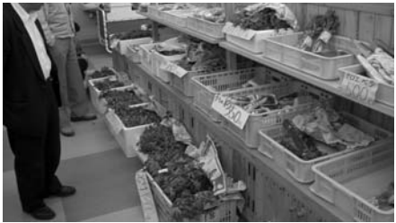
道の駅種山ヶ原「ぼらん」

道の駅種山ヶ原「ぼらん」と赤羽根直売所では、それぞれ山菜まつりを開催。シドケやタラの