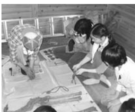
火縄は上手にできたでしょうか

●森林浴と溪流釣りの出来る町。住田町の魅力を感じることが出来る町と確信しました。