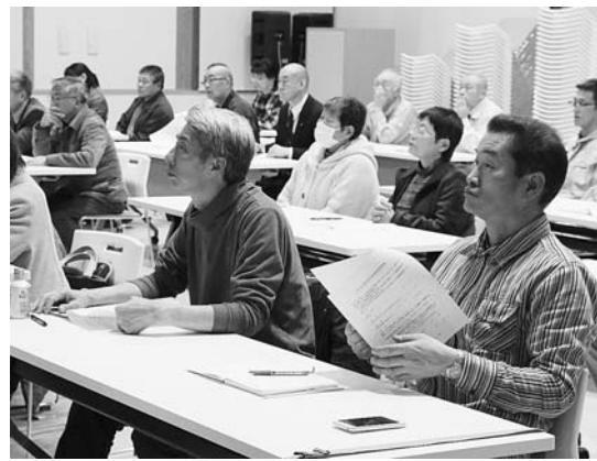
▲有機栽培に必要な方法を学ぶ参加者