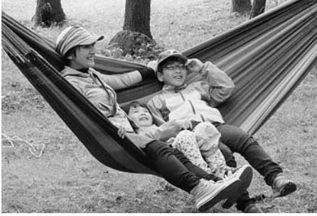
ハンモック教室には多くの家族連れが

鏡岩・せせらぎ公園は、天嶽地区の方々が環境整備活動を行い、誰もが気持ちよく散策できる場所です。自分自身が整備活動に参加したときに地域の活動をより多くの人に知ってもらいたいと感じ、ハンモック体験を企画しました。野外体験活動は自然を相手にするため、きちんとした安全管理が求められます。1年目は、町の自然や季節を知る期間と考えていろいろな場所を回りました。そこで感じたのは、上有住の自然の魅力と景観を保つため多くの人が携わっているということ。2年目は、この感じたことを生かして町の魅力をより広く発信していきたいです。町の皆さん、