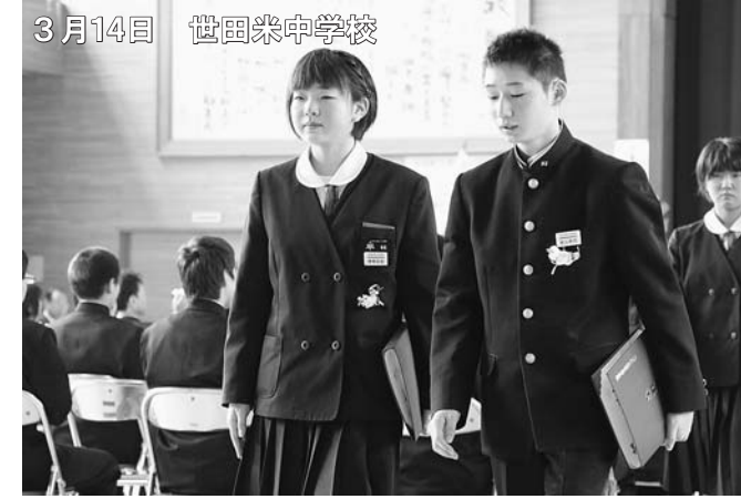
3月14日 世田米中学校