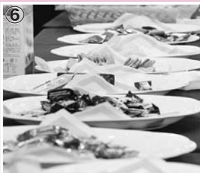
①海外派遣研修生がクップを実演②大きな拍手が送られたコンサート③民族衣装を試着中④留学生と町の魅力をディスカッション⑤自国を紹介する品々⑥試食コーナーには海外のお菓子がいっぱい