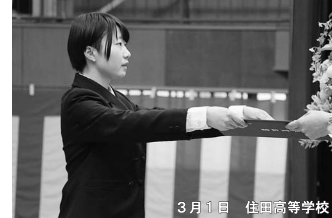
3月1日 住田高等学校