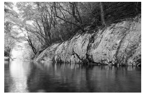
自然の魅力あふれる天嶽地区の「鏡岩」

私のミッションは、地区の魅力を生かすことに発信していくこと。現在は主に住田町の環境を生かした野外体験活動を行っています。昨秋には、地区内の「鏡岩・せせらぎ公園」にある林を生かした「森の息吹を感じるハンモック体験」を開催しました。