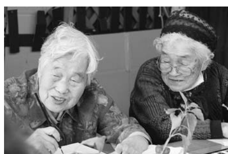
安心して暮らせるまちづくりへ

また、介護保険事業については、医療・介護・予防・生活支援などが一体的に提供される地域包括ケアシステムを推進し、介護サービスの充実に努めていきます。