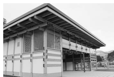
3月に川向に完成した新住田分署

中心活性化プロジェクト 住民交流拠点施設「まち家世田米駅」は、オープン以来、町内外の多くの方々にご利用いただき、新たな町の顔として