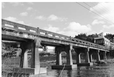
治水対策として整備する昭和橋

日常生活・生産活動の基盤である町道および橋は、計画的な改良、補修を進めていきます。河川整備並びに昭和橋の架け替えについては、災害の激甚化へ対応するため、整備促進を図るとともに、要望活動に取り組んでいきます。