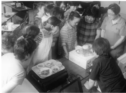
教室では予防に効果がある料理を学習