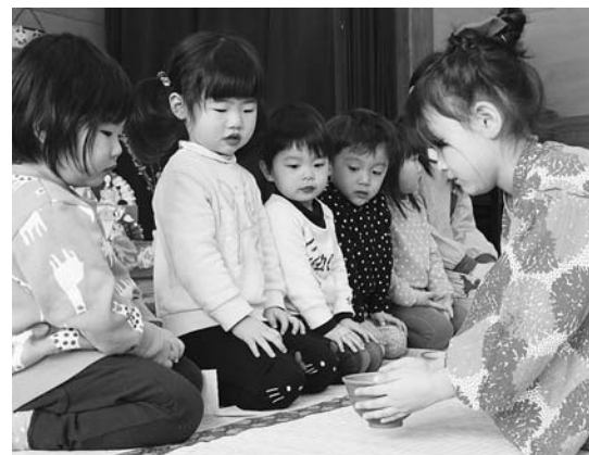
▲日本の伝統的なお茶会の作法を体験

3月3日の桃の節句にあわせて、世田米・有住両保育園では「ひな祭り会」が開かれました。 このうち有住保育園では、ホールに飾られたひな壇の前にごさが敷かれ、お茶会が行われました。5歳児ぞう組の園児たちは、着物に見立てた浴衣に着替え、お茶の出し方や立て方を教えてもらいながら、年下の園児たちにお菓子やお茶を振る舞いました。 お茶を受け取った園児たちは、緊張した様子で丁寧に茶碗を回して、ゆっくりとお茶を味わい、感想を聞かれると「おいしい!」と笑顔を見せていました。