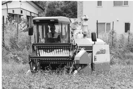
遊休農地を活用したそば栽培