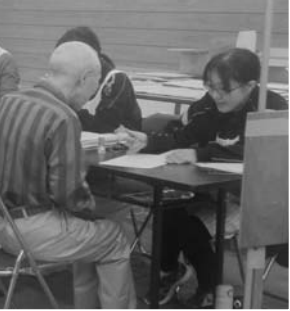
自分の体の状態を知るための特定健診

先月は「冬場の運動不足を解消しよう」をテーマにお知らせしました。今月は今年度の糖尿病対策を振り返ります。