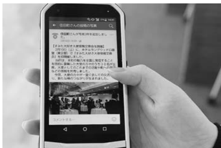
SNSを使い、町の魅力を広く発信

「農業の振興」 農業基本計画に基づき、農業者の高齢化や後継者・担い手不足、遊休農地の増大など