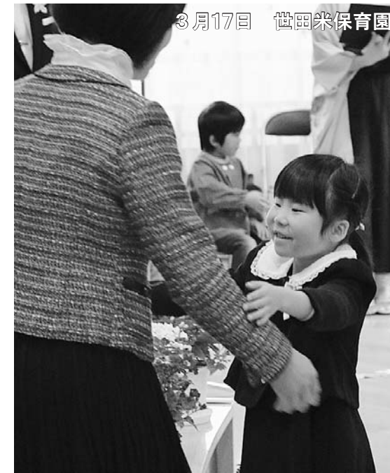
3月17日 世田米保育園