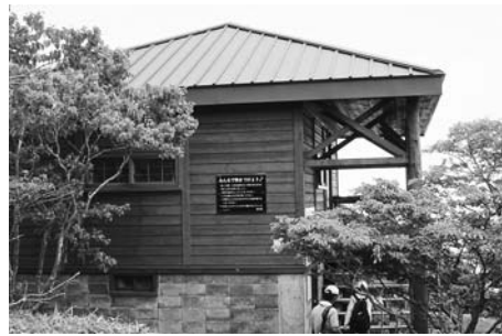
改築予定の五葉山「しゃくなげ荘」

国では、地方に必要な一般財源総額として、62・1兆円を確保するとしています。本町の平成30年度一般会計案の総額は、47億2000万円で、前年度より9300万円、2%増加しています。これは、消防ポンプ自動車更新などによる消防組合負担金の増や五葉山しゃくなげ荘の改築負担金の計上が主な要因です。平成30年度も施策の優先度に応じた、より一層の「選択と集中」を進めるとともに、限られた財源を有効に活用し、課題解決に向けて一丸となつて行財政運営に努めます。